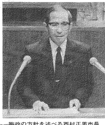
施政の方針を述べる西村正男市長

平成2年八幡市議会の第1回定例会(3月定例会議)で、西村正男市長は、平成2年度の予算案を提案するにあたり、「新年度における施政の方針と予算案の概要」について演説しました。ここにその全文を掲載します。なお、見出しは編集にあたって付したものです。