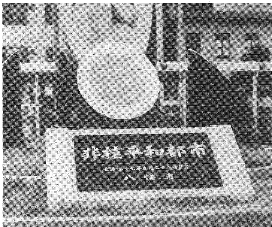
市民憲章の目標とする「ゆたかな暮らし、きれいなまち、あたたかい社会、すみよい都市、平和なふるさと」をめざして歩みつつけます

市民憲章の目標とする「ゆたかな暮らし、きれいなまち、あたたかい社会、すみよい都市、平和なふるさと」をめざして歩みつつけます。この目標を達成するためには、市民一人ひとりの協力が必要です。本市政は、市民の声を聞き、市民と共に歩んでいくことを目指します。