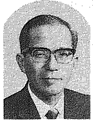
八幡市長 西村 正男

新しい年が今年もはじまるとして、市民のみなさまが、希望に燃れて、新年を迎えるに当たって、私どもからお願い申し上げます。