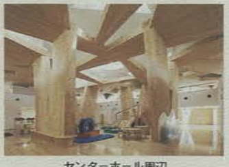
センターホール周辺

B 絵本の世界を楽しめるよう1,000冊の絵本を揃え、自由に空想の世界を広げられるジオラマテーブルを配置した絵本・パズルルーム D 木製のすべり台など、小さな成長を促す遊具で、からだ全体を使った運動が楽しめるセンターホール