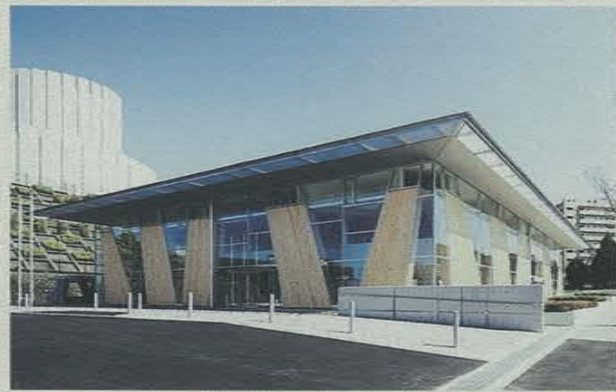
完成した子ども・子育て支援センターすくすくの杜