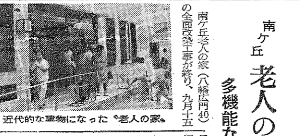
近代的な建物になった「老人の家」

日ごろ鍛えた体とチームワークを発表しよう。と、九月二十二日、今年四月に開校した南八幡高校で一年生ばかりの二百二十一人による体育大会が開催されました。