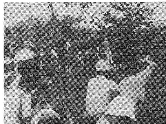
参加者のみなさんは、探りそで姿もあややかなミス着物をモデルに何度もシャッターを切っていました(写真はさくら公園で)

サクルに加入を 市内には十九の体育団体(連盟)があり、体育振興会をつくらせようとしています。あなたも加入して、左表の代表者に申し込んでください。