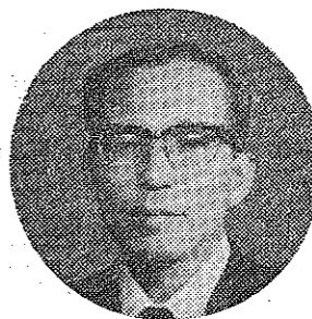
八幡市長 西村正男

あけましておめでとうございます。新しい年のはじめにあたり、市民のみなさん方の幸せを心からお祈り申し上げます。同時に、日頃のご協力と厚くお礼を申し上げます。