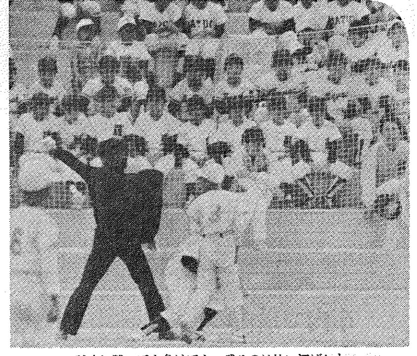
試合に勝っても負けても、残るのは快い汗ばかり...