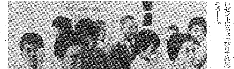
タントン、おじいさん、おばあさんの背にまわって... ...市民のひろば... ...おじいさん... ...おばあさん...