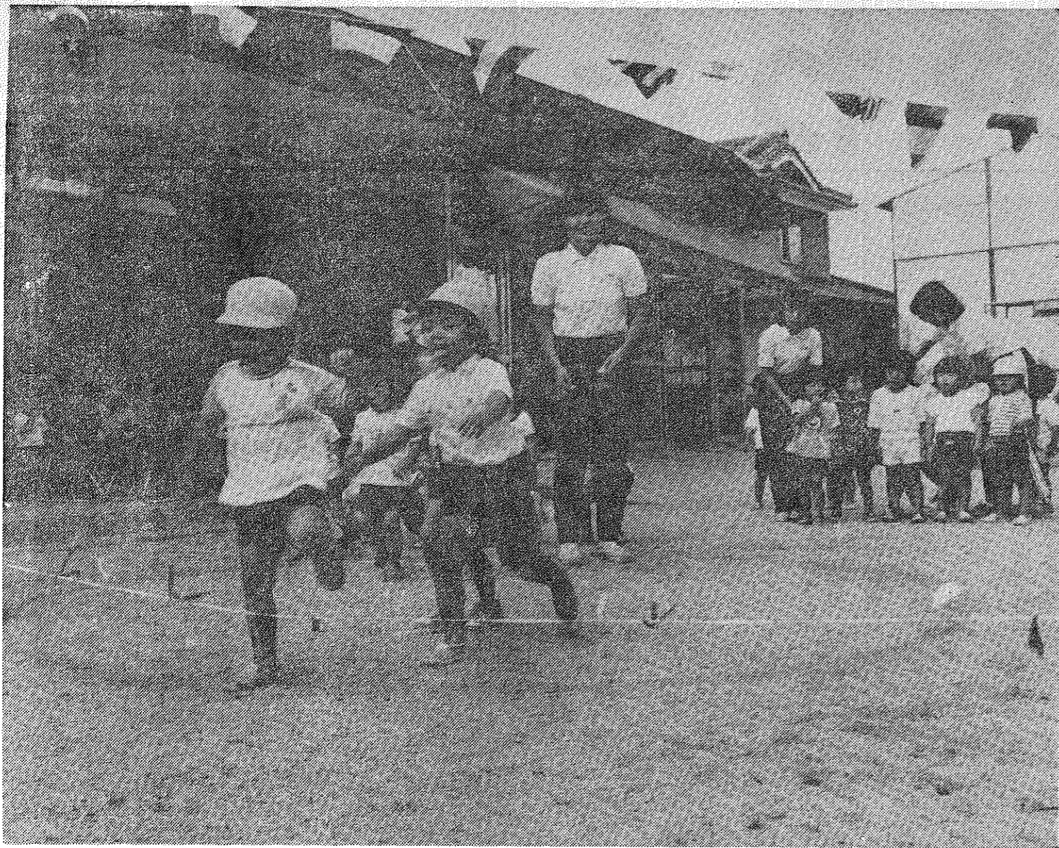
「がんばれ、がんばれ——」お母さんの暖かい声援をうけて、子どもたちは猛ハッスル（南ヶ丘保育園の運動会）