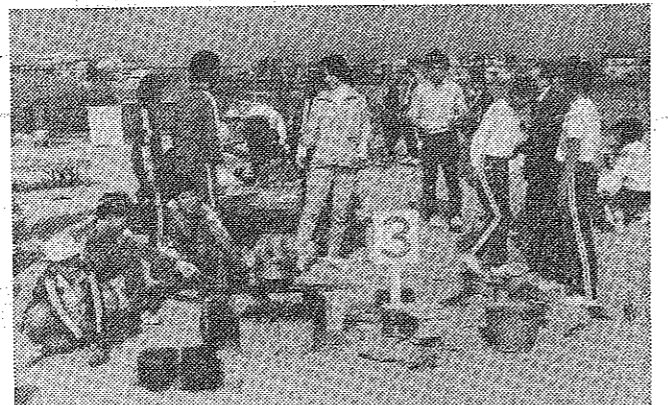
有都小で障害児が楽しい一日

野外学習会 交流と親ほく 十一月十二日、有都小で「お母さんといっしょに飯ごう炊さん」の野外学習会が開催されました。この会は、障害児とその保護者、および地域の親子を対象として、野外学習の機会を提供し、交流を深めることを目的としています。当日は、飯ごう炊き、お餅つき、お茶会などを行い、大いに盛り上がりました。