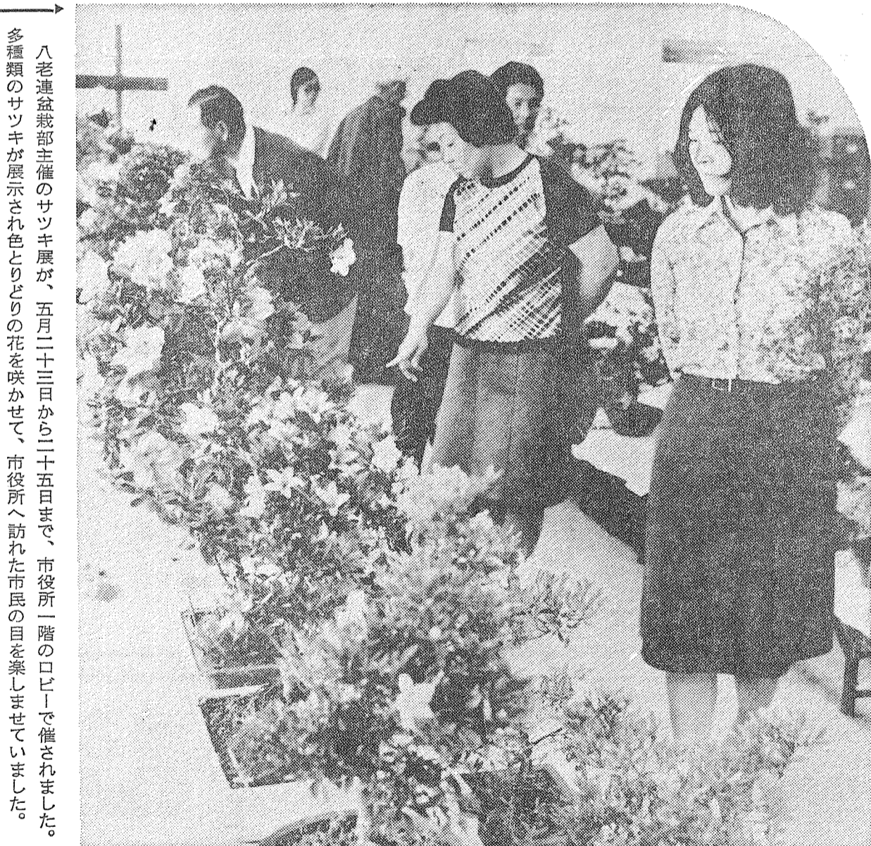
八老連盆部主催のサツキ展が、五月二十三日から二十五日まで、市役所一階のロビーで開催されました。多種類のサツキが展示され色とりどりの花を咲かせて、市役所へ訪れた市民の目を惹きつけていました。