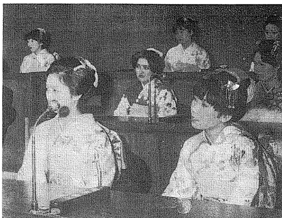
市議会議場で議会の説明に聞き入る新成人を迎えたいみなさん

一月十五日の夜、新成人の成長を祝う成人式が、市立市民会館で挙行された。新成人は、市立市民会館で、市立市民会館の力強い指導を受け、おとなの仲間入りを果たした。成人式は、市立市民会館で、新成人の成長を祝う成人式が、市立市民会館で挙行された。新成人は、市立市民会館で、市立市民会館の力強い指導を受け、おとなの仲間入りを果たした。