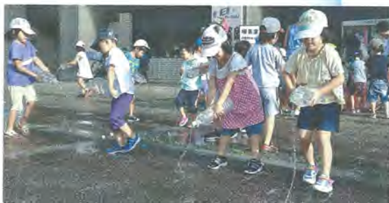
昨年の「打ち水大作戦」の様子

誰もが手軽にできるヒートアイランド対策、さらには地球温暖化対策の取り組みとして、8月3日(月)の午後5時20分から、市役所敷地内で「打ち水大作戦」を実施します。 ペットボトルに風呂の残り湯や雨水を入れてご参加