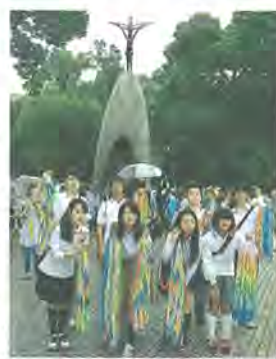
原爆の子の像の前で平和を誓う平和大使(昨年8月6日、広島)

平和大使は、市内4中学校から各2人の生徒と市民ら合計11人です。原爆死没者追悼平和祈念館や平和記念資料館