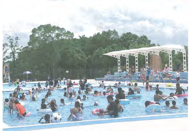
プールで遊ぶ来園者たち

同プールの営業は、8月31日まで。時間は午前9時～午後5時(入園は午後4時まで)。