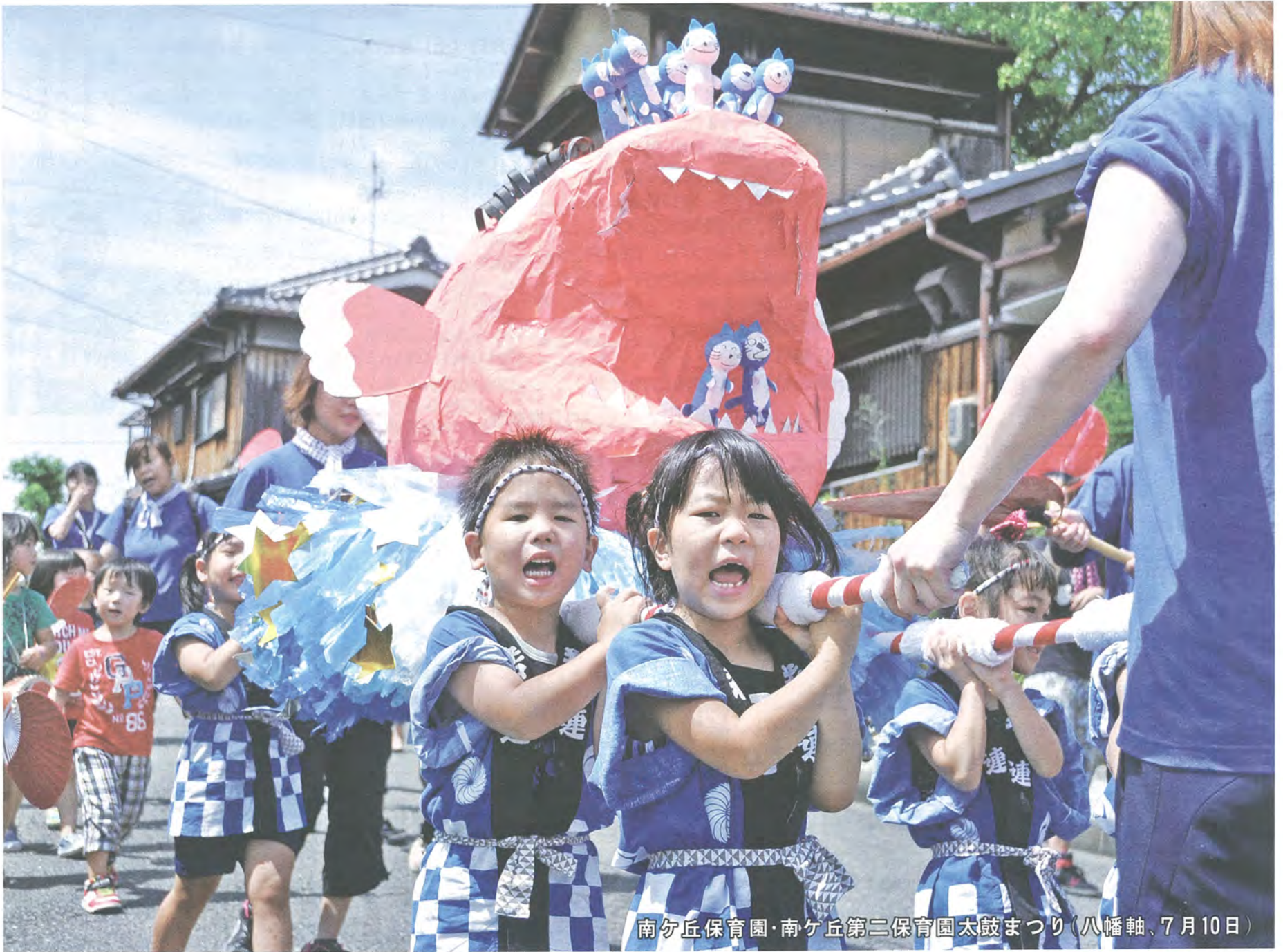
南ヶ丘保育園・南ヶ丘第二保育園太鼓まつり(八幡軸、7月10日)