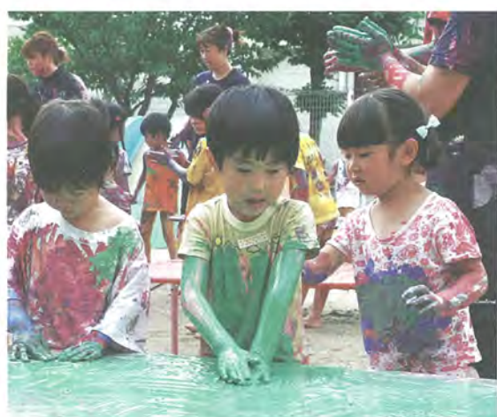
体に絵の具を塗り合ったりする園児たち