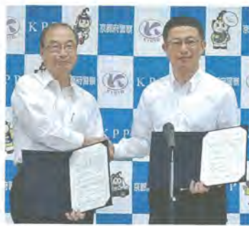
協定締結後、山下史雄府警本部長(右)と握手を交わす市長

市は7月6日(月)、府警察本部と「京都一安全安心・自然と歴史文化が調和する八幡市民ぐるみ推進運動」協定を締結しました。 相互に連携し、市民の皆さんが安全で安心できるまちを目指します。