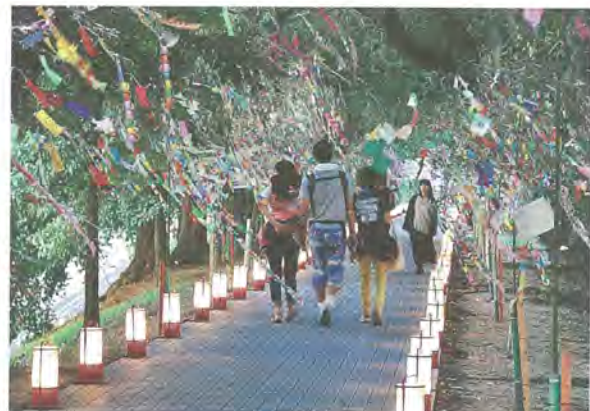
日暮れとともに園路をライトアップ(過去の七夕まつり)