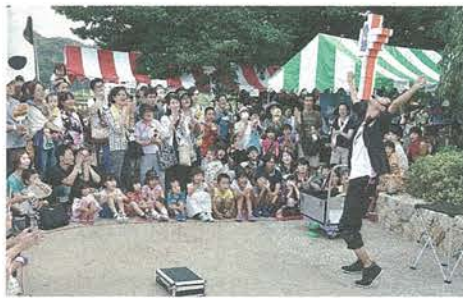
ジャグリングパフォーマンスに拍手を送る来場者たち

同まつりは、淀川三川合流域の魅力を知ってもらおうと、市内NPOや市などで構成される七夕まつり等ふれあい交流実行委員会が主催しました。