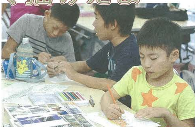
恐竜の復元画作成に取り組む子どもたち