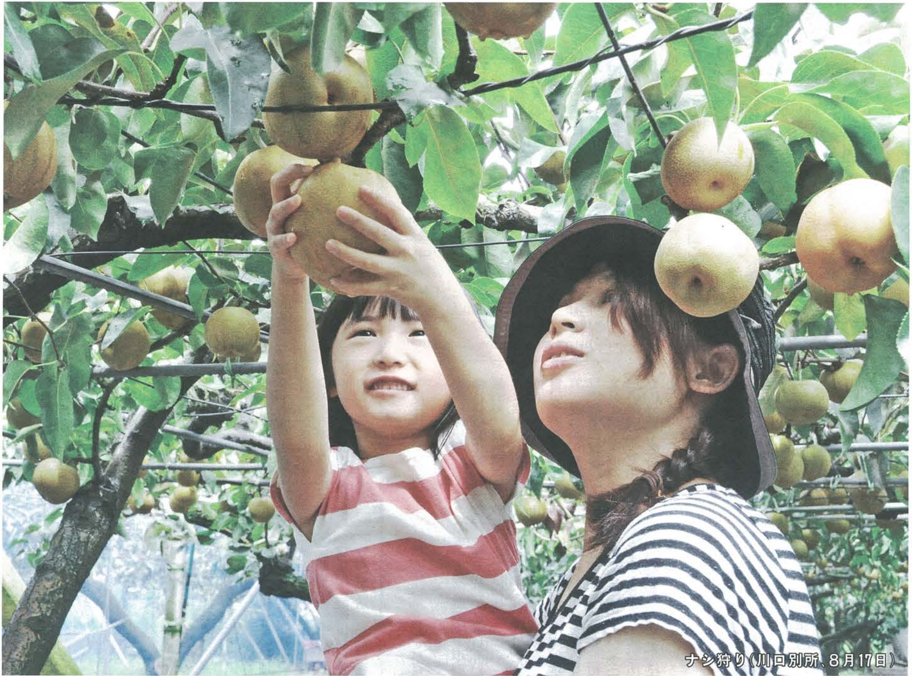
ナシ狩り(川口別所、8月17日)