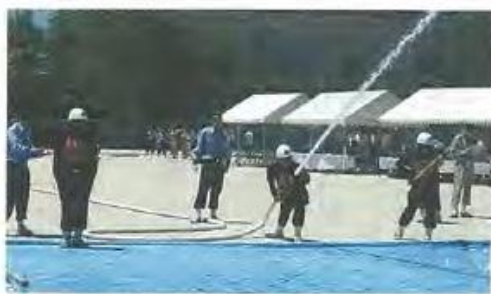
大会で活躍する選手たち

この大会は、消防団員の技術の向上と士気高揚を図るため2年に1回開催。小型ポンプから火点へ向けて放水する一連の流れ、動作の機敏性と正確性、安全性を競います。 出場選手たちは、団員の協力のもと、連日の猛暑に