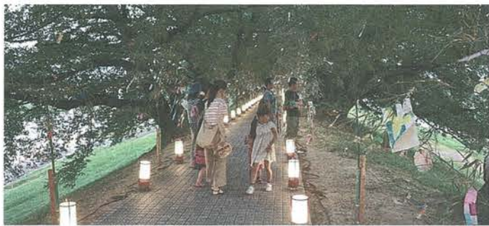
ライトアップされた園路を歩く来場者たち

8月7日～9日の3日間、淀川河川公園背割堤地区で「納涼七夕まつり」が開催され、市内外からの約2900人の来場者でにぎわいました。