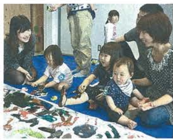
すくすくの杜のイベントの様子

子育て世帯臨時特例給付金の申請期限は、11月30日(月)です。※期限を過ぎると給付を受けることができなくなります。忘れずに申請してください。 ◆問い合わせ 子育て支援課