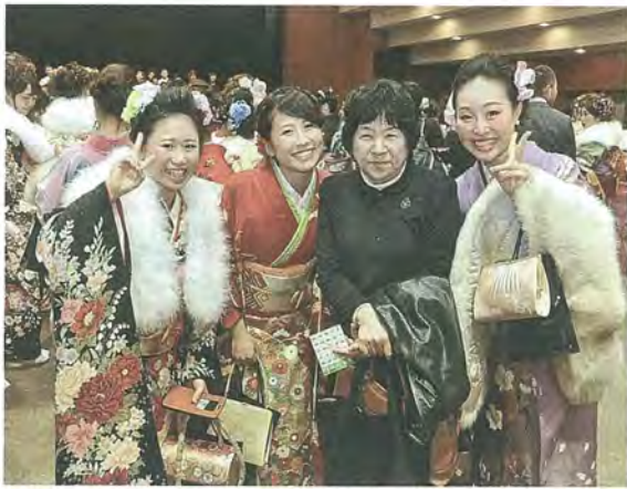
恩師と写真に写る新成人たち

新成人の門出を祝う「成人式」が1月11日、文化センター大ホールで行われ、色鮮やかな振り袖や羽織袴、スーツを身にまとった新成人447人(対象者672人)が出席し、旧友たちとともに人生の新たなスタートを切りました。