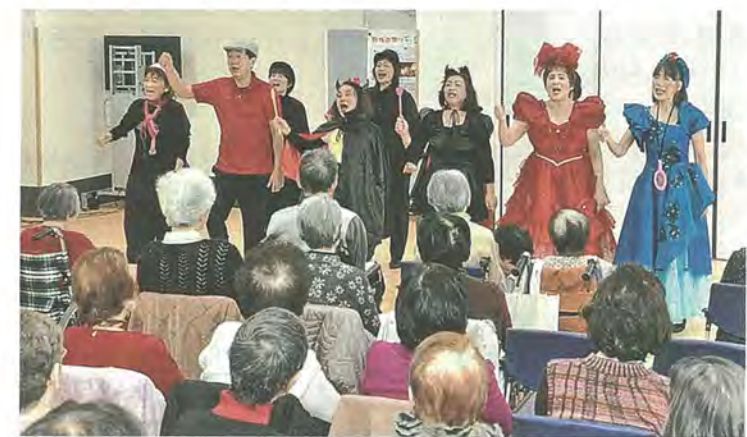
「オレオレ詐欺」を題材にしたミュージカル

同事業は、市や京都府、八幡警察署などで男山地域の消費者被害の防止などに取り組む男山地域安心・安全コミュニティ創造プロジェクトの特殊詐欺部会が主催。ミュージカルや喜劇、クイズなど、さまざまな形式で啓発が行われました。