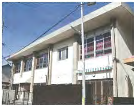
改修後の有都交流センター

老朽化した有都交流センターの大規模修繕とバリアフリー化工事が完了しました。 主な工事内容は、次の通りです。