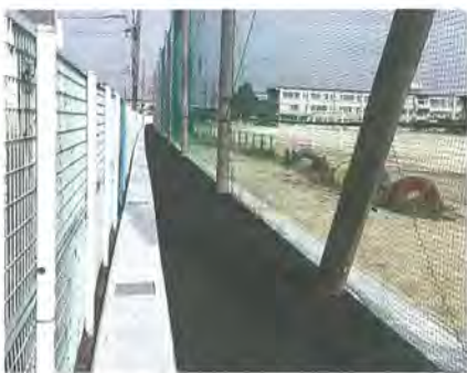
中央小学校敷地内通路

中央小学校の校舎西側道路は、道幅が狭いうえに自動車の交通量が多く危険なため、小学校内のグラウンド西側フェンスに沿って新たに通路を整備し、あわせて側溝や門の改修もしました。