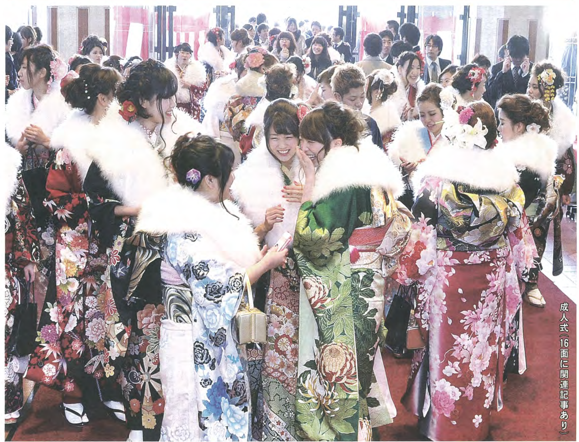
成人式(16面に関連記事あり)