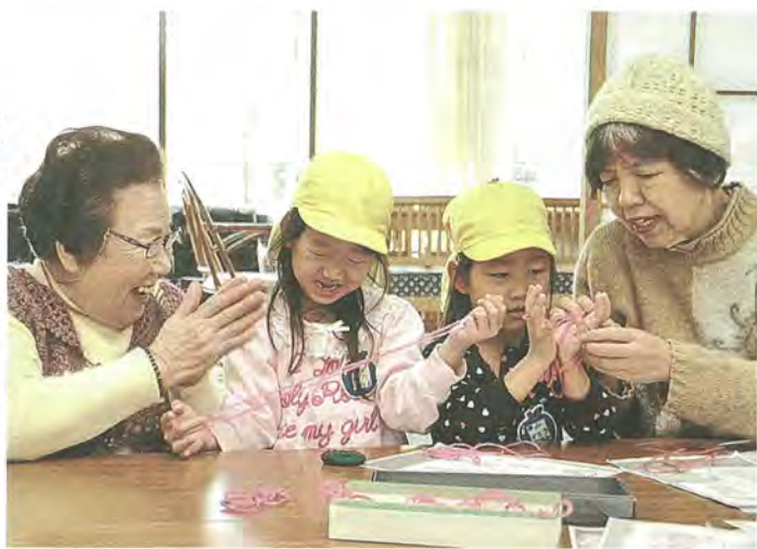
あやとりを教える園児たち

最後は、同メンバーから園児たちに折り紙で作ったコマをプレゼント。園児たちはうれしそうに受け取り、地域の高齢者たちとの交流を最後まで満喫していました。