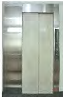
設置されたエレベーター