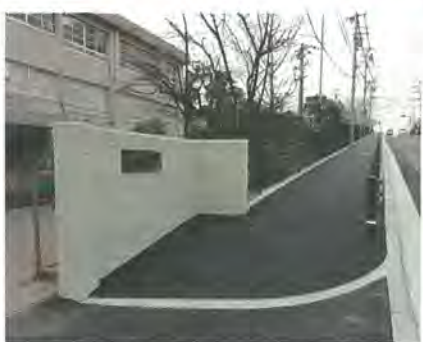
さくら小学校北側の拡幅後の歩道