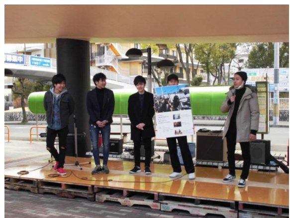
各チームによる活動報告会の様子です。