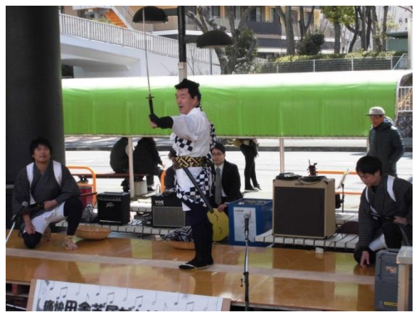
田舎芝居チームは國定忠治を上演しました。