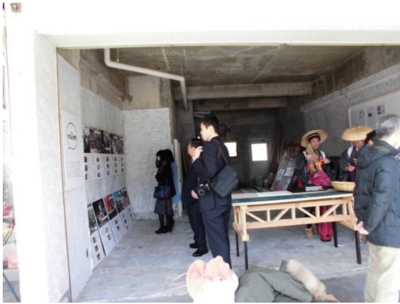
団地再生について考えるブースです。