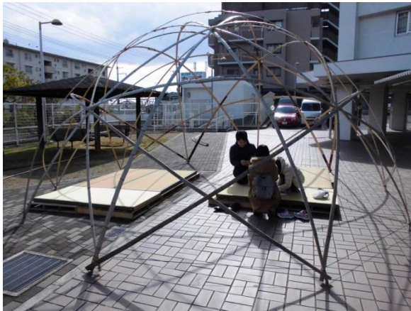
てのひらスター★ドーム作りの様子です。直径6mのスタードームも作りました。