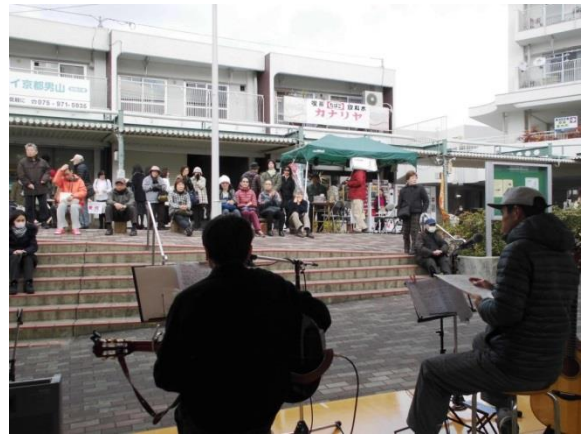
フォークソングミニライブの様子です。たくさんの方に聴いていただきました。