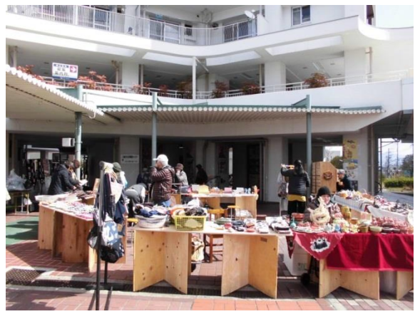
手作り市の様子です。