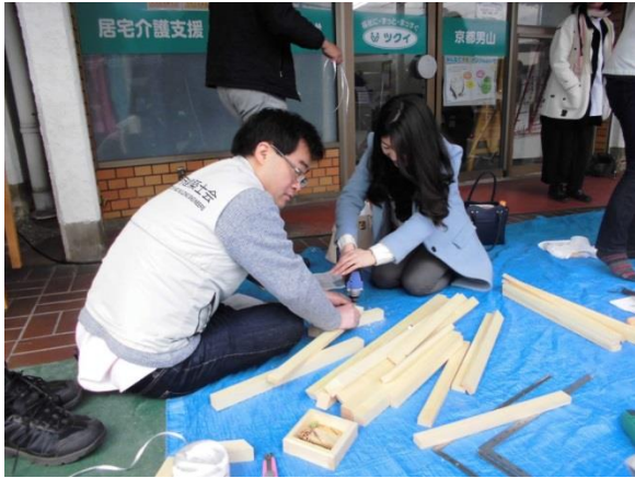
建築士会のサポートを受けながらワークスタン ド作りのD I Y体験ができます。