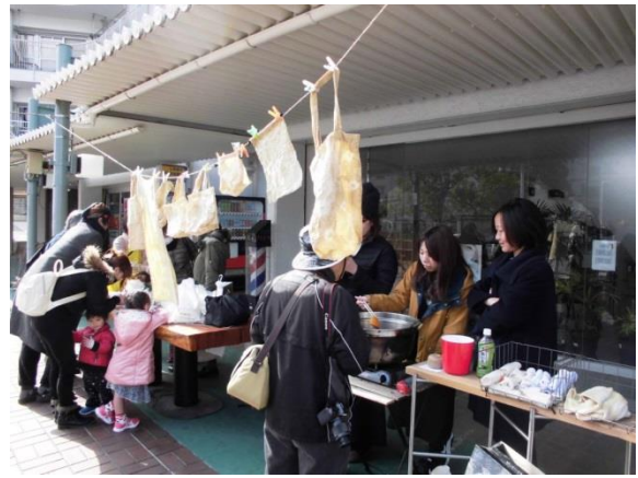
緑道 de 草木染めの様子です。