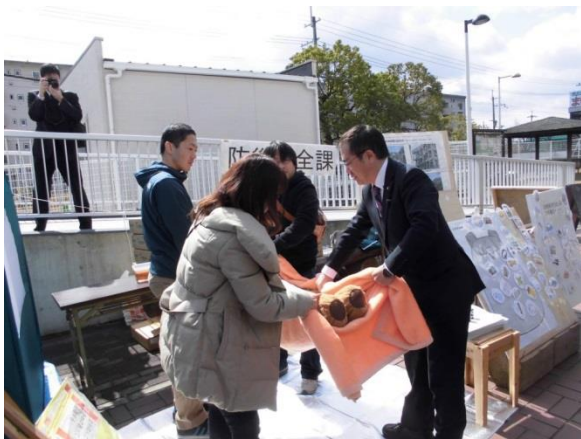
毛布 de 担架の様子です。