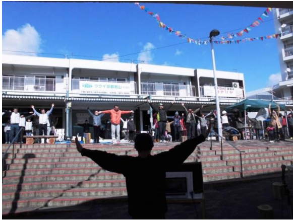
だんだんテラスで恒例となっているラジオ体操で祭りがスタートします。