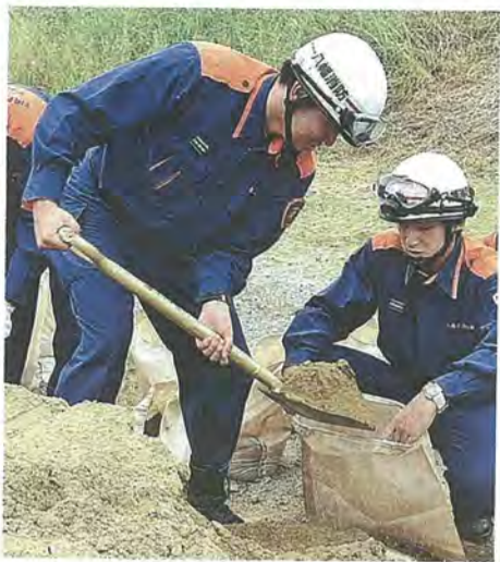
土のうを作る消防隊員たち

同訓練は、水防工法の基礎的な技術の習得から水防体制の強化を図ろうと、毎年実施されています。約130人の参加者は7つの小隊に分かれ、「訓練はじ