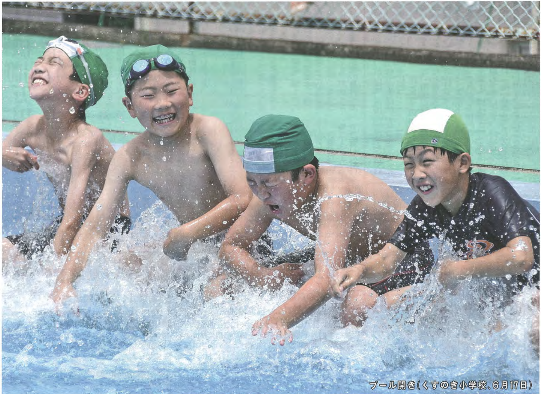
プール開き(くすのぎ小学校、6月17日)