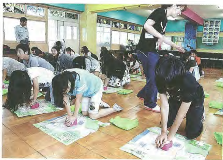
胸骨圧迫の練習に取り組む児童たち

このページでは、市民の皆さんの活躍やまちの話題などを紹介しています。身近な話題や、広報紙についての意見を、秘書広報課までお寄せください。