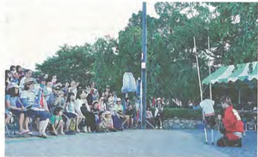
猿まわしパフォーマンスを楽しむ来場者たち

また、会場には願いごと記載所が設けられ、来場者は、願いごとを書いた短冊を、堤防上の園路に飾られた笹に結んでいました。日暮れ頃からは、約400灯籠に明かりが点灯。来場者は、園路を包むやわらかな光と、涼しげな風鈴の音色が織りなす心地よい空間をそぞろ歩いていました。