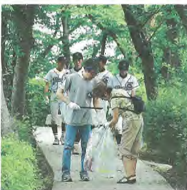
6月の清掃活動の様子(さくら近隣公園周辺)