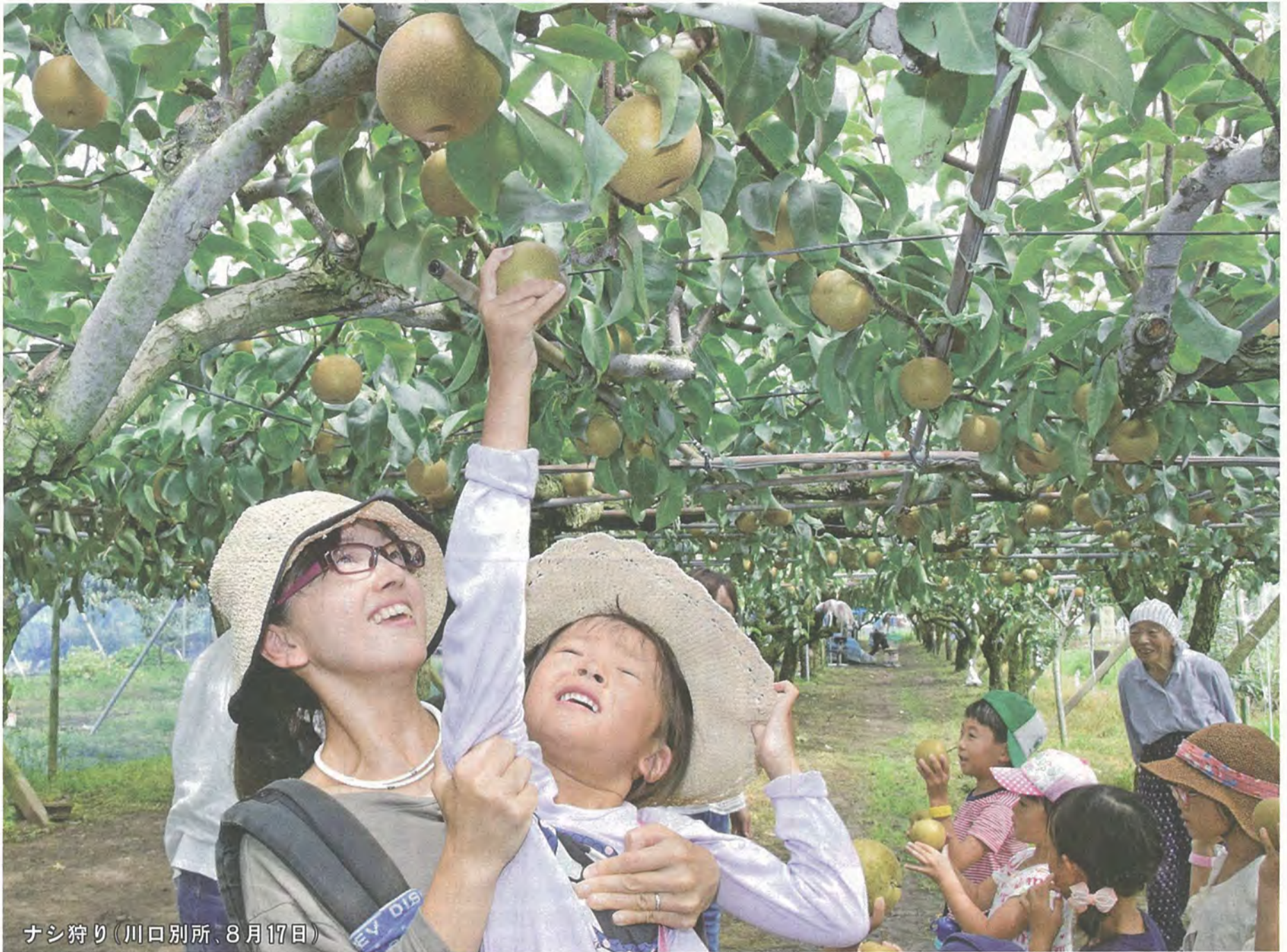
ナシ狩り(川口別所、8月17日)