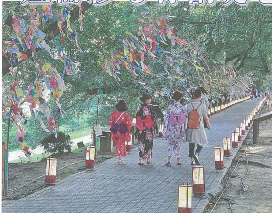
園路をそぞろ歩く来場者たち

同まつりは、淀川三川合流地点の歴史や自然、景観の魅力を知ってもらおうと、市内NPO団体や国・府・市などで開催。期間中は、人気飲食店の模擬店が立ち並び、雪遊びコーナーや男山第二中学校の吹奏楽部による演奏、カヌー体験など、さまざまなイベントが催されました。7日には、熊本地震で甚大な被害を受けた「阿蘇猿まわし劇場」による震災復興支援チャリティ公演を実施。猿が竹馬などの芸を成功させる度に、観客からは大きな拍手が送られていました。