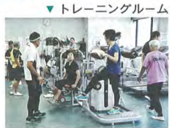
▼トレーニングルーム