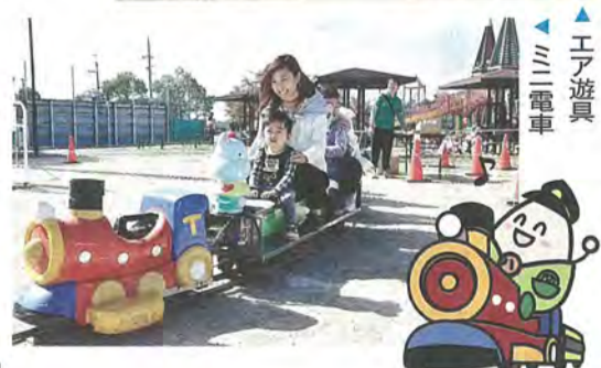
▲エア遊具 ▲ミニ電車