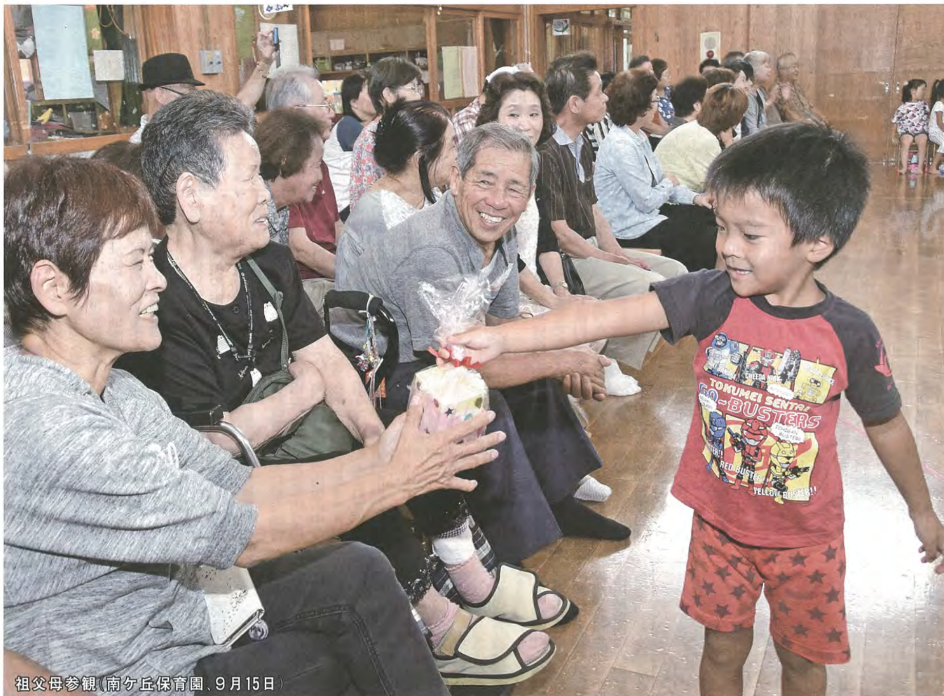
祖父母参観(南ヶ丘保育園、9月15日)