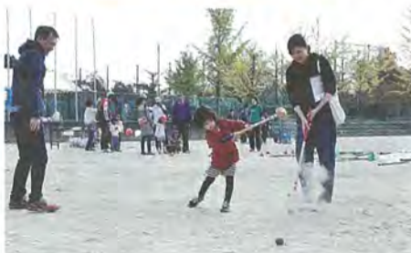
▲グラウンドゴルフ