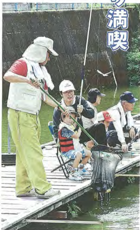
協力してコイを釣り上げる親子