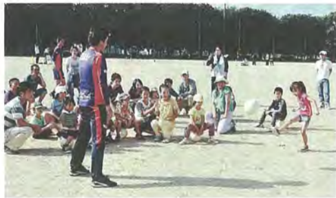
▲子どもボール遊び教室

京都サンガF.C.のスタッフと一緒に、ボールを使ってできる遊びや簡単な運動を体験してみましょう。(参加申し込み終了)