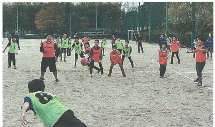
決勝戦で勝負を繰り広げる子どもたち

各チームの子どもたちは、トーナメント方式で対戦。外野とコート内のチームメイトが、素早いパス回しを行い、外野の両サイドからアタックするなどして、相手のすきを突く見事なプレーを見せていました。 決勝戦では、両チームのクラスメイトや保護者たちが、「行けー!」「頑張れー!」と、大きな声援を送る中、相手の投げたボールを近距離でキャッチしたり、ひらりとかわしたりするたびに、拍手や歓声が沸き起こっていました。