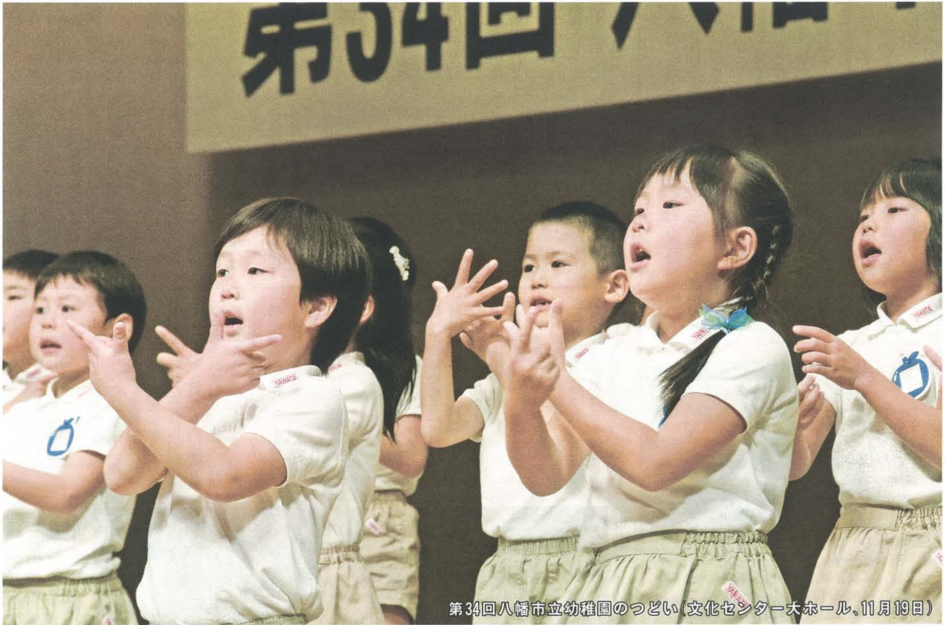
第34回八幡市立幼稚園のつどい(文化センター大ホール、11月19日)