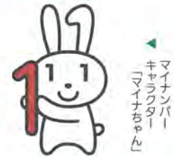
マイナンバー キャラクター 「マイナちゃん」

マイナンバーカードをお持ちの人を対象に、コンビニエンスストアなどのマルチコピー機(多機能端末機)で住民票の写しなどの各種証明書を取得できる取り組みを10月から始めています。