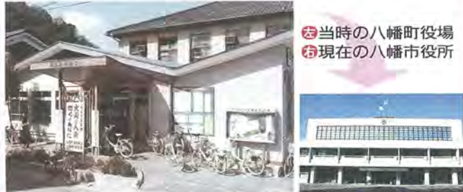
当時の八幡町役場 現在の八幡市役所

平成29年11月1日に八幡市は市制施行40周年を迎えます。これを記念して、1月号から10月号で、八幡町から市になった当時の思い出を、写真を交えながら紹介します。第1回は「役場・庁舎」です。