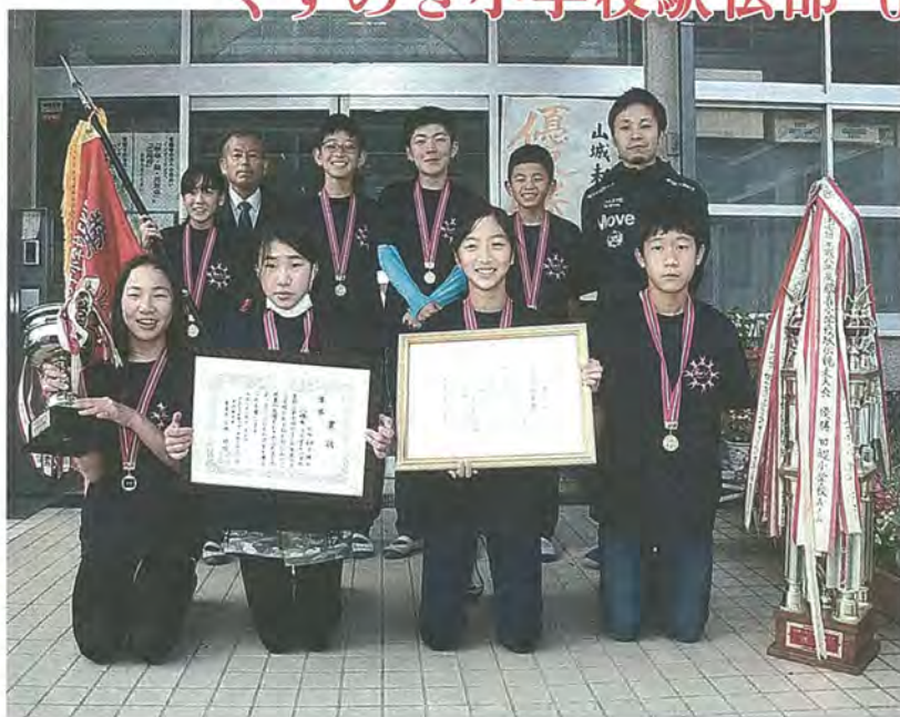
▲ 優勝した同校の駅伝メンバーたち