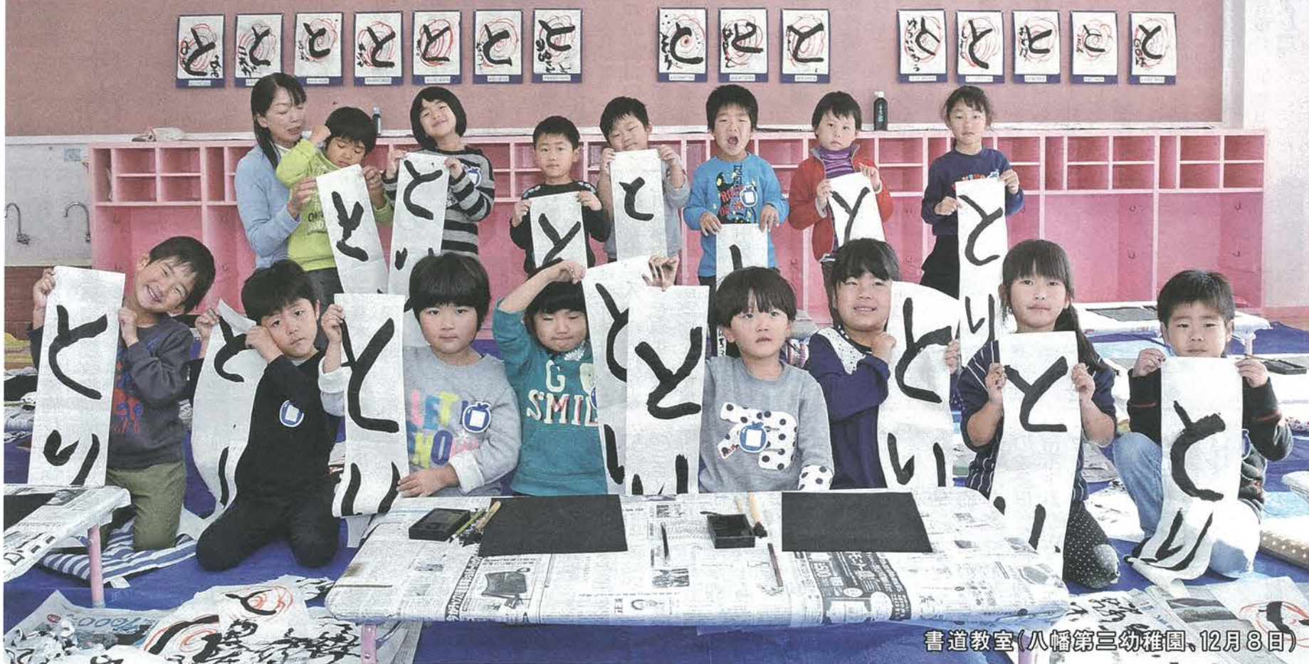
書道教室(八幡第三幼稚園、12月8日)