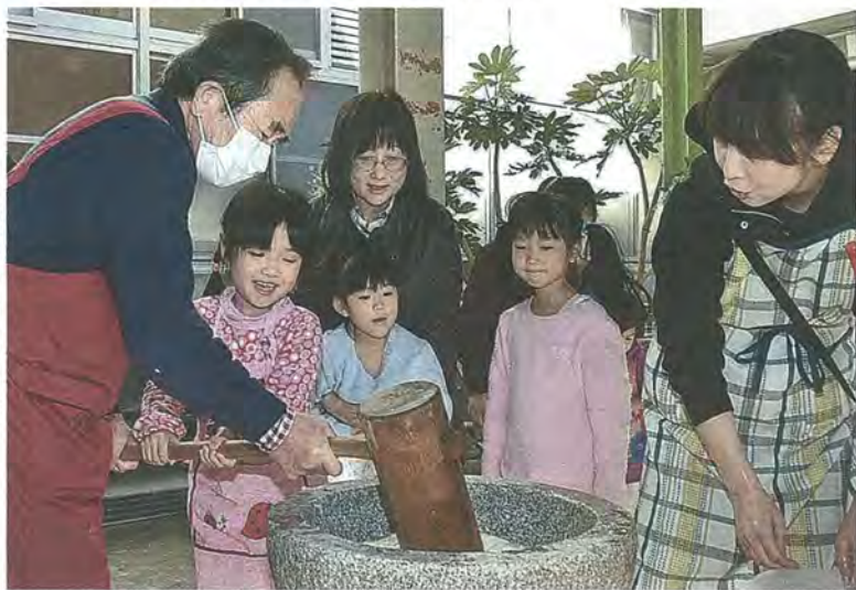
もちつきをする子どもたち

イショ！」と掛け声をあげ、もちつきを盛り上げていました。 体育館内では、今か今かつきたてのもちが出来上がるのを待つ子どもたちの姿が見られ、きなこもちやあんもち、ぜんざいといった、もちづくしのメニューを家族や友だちと一緒に笑顔でほお張っていました。また、会員たちが家庭菜園などから持ち寄った野菜をふんだんに使った豚汁も振る舞われ、来場者はおいしそうに味わっていました。