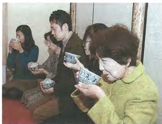
茶室でお茶を楽しむ参加者たち(松花堂)

「このページでは、市民の皆さんの活躍やまちの話題などを紹介しています。身近な話題や、広報紙についての意見を、秘書広報課までお寄せください。」