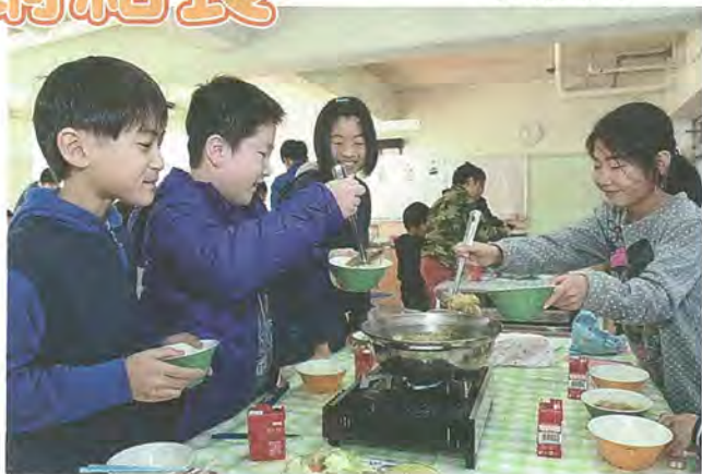
具材を器によそう児童たち

橋本小学校で12月15日、「鍋給食」が行われ、5年4組では児童30人が先生たちと一緒に鍋を囲みました。 市内の小学校では、毎年冬になると、5年生を対象に鍋給食が実施されています。 今年度は昨年度に続き、人気のカレー鍋。各班のテーブルには事前に調理員が具材や鍋、ガスコンロを用意。児童たちの「いただきます」を合図に、コンロに火が付けられました。鍋蓋のすき間から湯気が立ち、カレーの香り