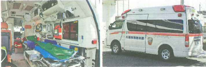
更新した災害対応特殊救急自動車(写真右)と、車内の状況(同左)