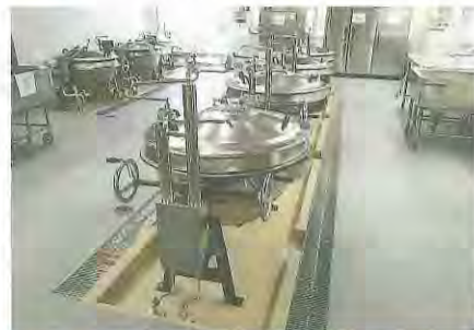
整備後の中央小学校の給食室