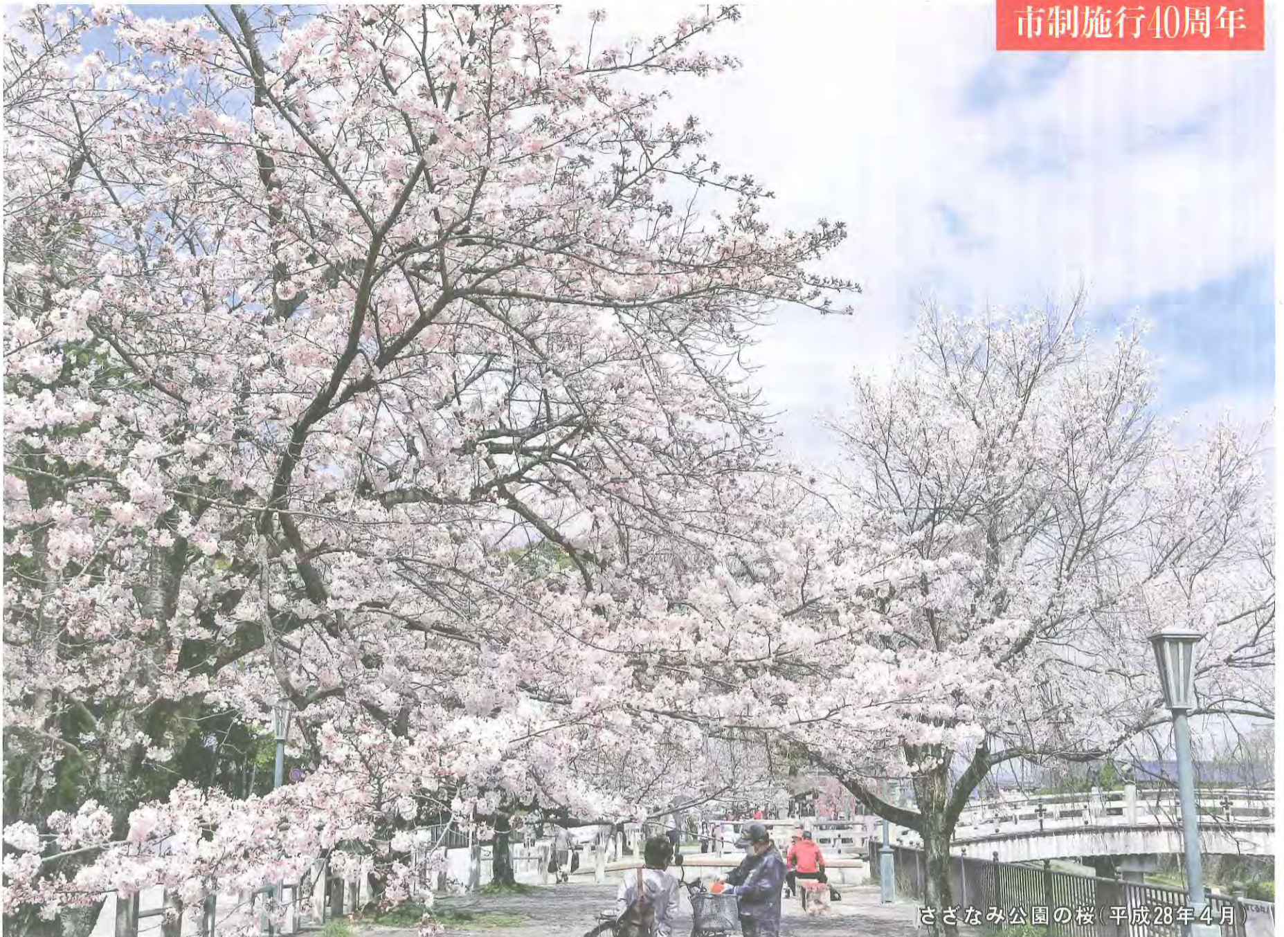
さざなみ公園の桜(平成28年4月)