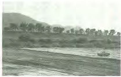
②当時の背割堤地区の松並木 ①現在の背割堤地区の桜並木

八幡が町から市になった当時の思い出を、写真を交えながら連載で紹介していきます。 ウェブサイトのお花見スポットランキングで常連の背割堤地区の桜並木。実は、昭和50年代初めまでは松並木でした。別名「山城の橋立」とも呼ばれ、時代劇の撮影場所として利用されてきました。しかし、昭和40年代後半に害虫による松枯れの被害が拡大したため、昭和53年、建設省(現在の国土交通省)が桜への植え替えを実施。遊歩道等の整備を進め、昭和63年4月に桜並木が一般開放されました。 今では、春になると約250本のソメイヨシノが1・4kmにわたって咲き誇り、多くの来園者を魅了しています。また、3月25日には、同地区内に三川合流域拠点施設「さくらであい館」がオープン。展望塔が整備されており、地上約25mの高さから桜並木を楽しむことができます。