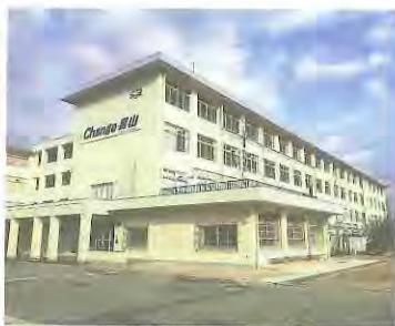
改修後の南側校舎

主な工事内容は、外壁改修・内装改修・トイレ改修・建具改修・照明設備改修・空調設備改修などです。