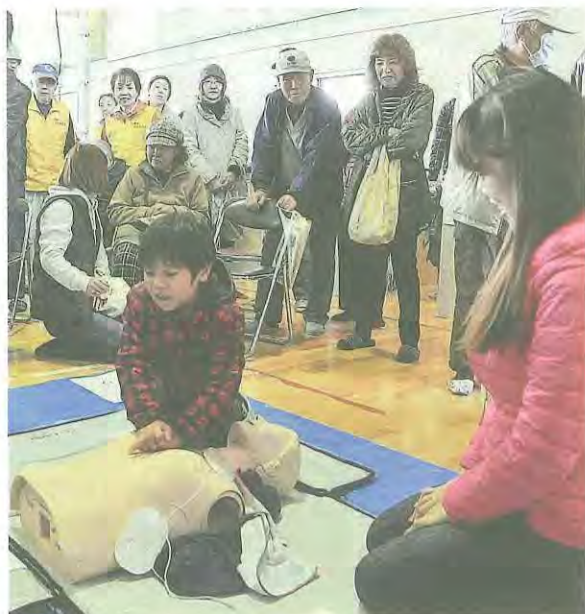
応急処置の胸骨圧迫を行う参加者(くすのき小学校)

東日本大震災から6年。地震や火災など、予期せぬ災害に備え、地域住民への防災意識の向上を目的とした防災訓練が、くすのき地区で3月5日、美濃山地区で12日に行われました。