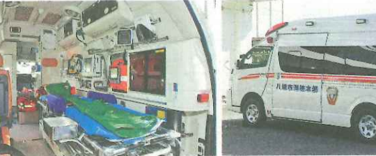
更新した災害対応特殊救急自動車(写真右)と、車内の状況(同左)