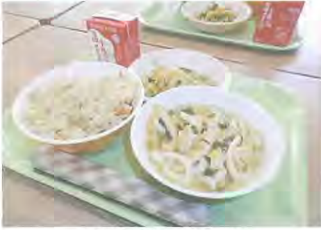
中学校給食のイメージ