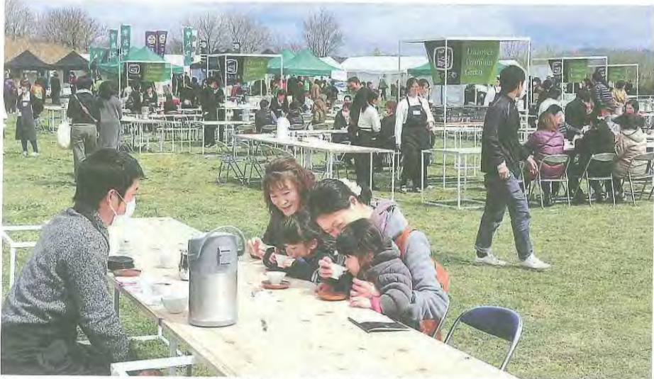
「宇治茶BAR」でお茶を味わう来場者たち

宇治茶のふるさと京都府南部・山城地域12市町村を舞台に、1年を通してお茶にまつわるイベントを展開する「お茶の京都博」のオープニングイベント「さくら茶会」が4月1日、2日の2日間、淀川河川公園背割堤地区で開催されました。