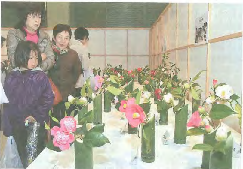
色とりどりのつばきを楽しむ来場者

「このページでは、市民の皆さんの活躍やまちの話題などを紹介しています。身近な話題や、広報紙についての意見を、秘書広報課までお寄せください。」