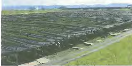
覆いをかぶった茶畑