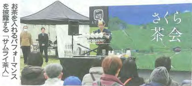
お茶を入れるパフォーマンスを披露する「サムライ茶人」

また、近隣市町村などからお茶関連の物産品が展示されたり、バーテンダー扮する「サムライ茶人」によるボトルを投げるなどしてお茶を入れるパフォーマンスが披露されたりするなど、来場者たちはさまざまな形で宇治茶の魅力に触れていました。