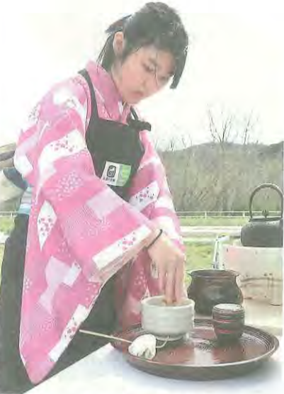
抹茶を点てる京都八幡高校の生徒

八幡市抹茶席では、京都八幡高校の生徒らが、市で生産された碾茶を加工して作られた抹茶「浜乃風」を点て、市内中学生たちがお茶とお茶菓子を運び、来場者たちが緑が広がる自然の中で抹茶を味わいました。