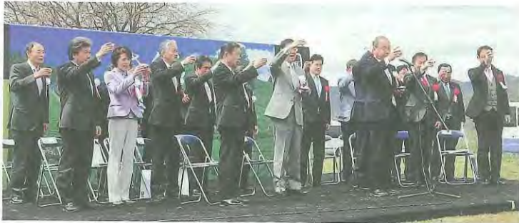
宇治茶で乾杯する開会式典出席者たち

「お茶の京都博」は、府や山城地域12市町村などで構成される実行委員会が主催。お茶の生産地に赴いてもらい、歩いて、見て、味わうことで新しい宇治茶の魅力を見つけてもらおうと、さまざまなイベントが企画されています。