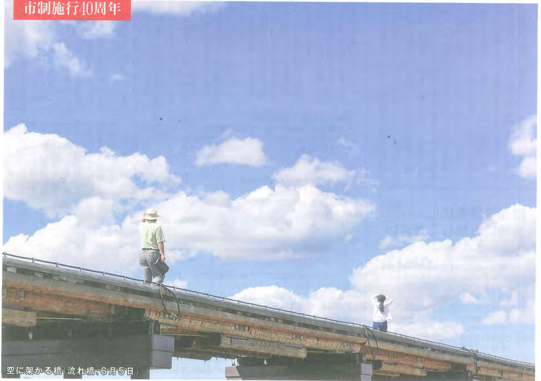
空に架かる橋(流れ橋、6月5日)