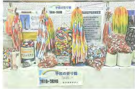
昨年寄せられた折り鶴

で展示した後、市内中学生らの平和大使により8月6日(日)、広島平和記念公園の「原爆の子の像」にささげられます。※折り紙、回収カゴ設置場所=市役所、八幡人権・交流センター、公民館、コミュニティセンター、生涯学習センター、市民図書館ほか。