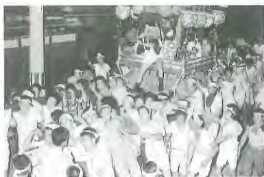
当時の太鼓まつり 現在の太鼓まつり

戦後になり休止された時期もありましたが、ふるさと意識の高まりから各区で次々と復活し、現在では屋形太鼓を保存する一区、二区、三区、六区で構成する太鼓まつり連絡協議会がまつりを実施。また、例年7月18日に行われていた各区の屋形太鼓が神社に集う「宮入り」は、平成26年から「海の日」の前日に変更し、毎年の統一宮入りを実現しました。多くの観衆が境内に詰めかけ、屋形太鼓を威勢よく揺さぶりながら参道を練り歩く担ぎ手たち。その姿は今も八幡のまちに熱気を与えてくれています。