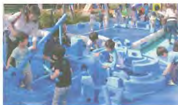
イマジネーション プレイグラウンド サイバーホイール ▶

日時 11月10日(金)・11日(土) 両日も午前10時~正午、午後1時30分~3時30分 場所 子ども・子育て支援センター すくすくの杜 対象 市内在住の就学前のお子さんとその保護者 定員 各日午前・午後、各75組 内容