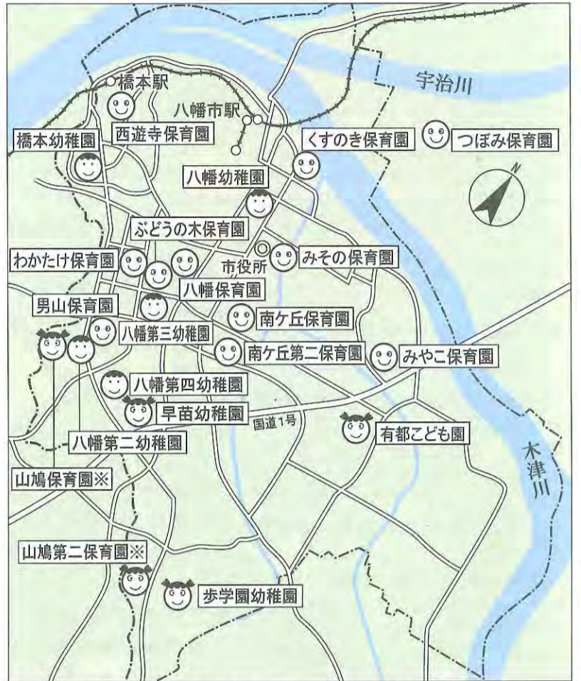
※山鳩保育園、山鳩第二保育園は平成30年4月に幼保連携型認定こども園に移行予定です。

★保育の必要な理由 ①就労(1カ月あたり64時間以上労働することが常態である場合) ②妊娠・出産(妊娠から産後おおむね2カ月まで) ③疾病・障がい ④介護・看護(同居等の親族の) ⑤災害復旧