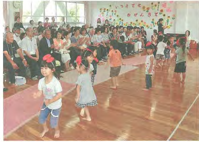
祖父母らに歌と踊りを披露する園児たち