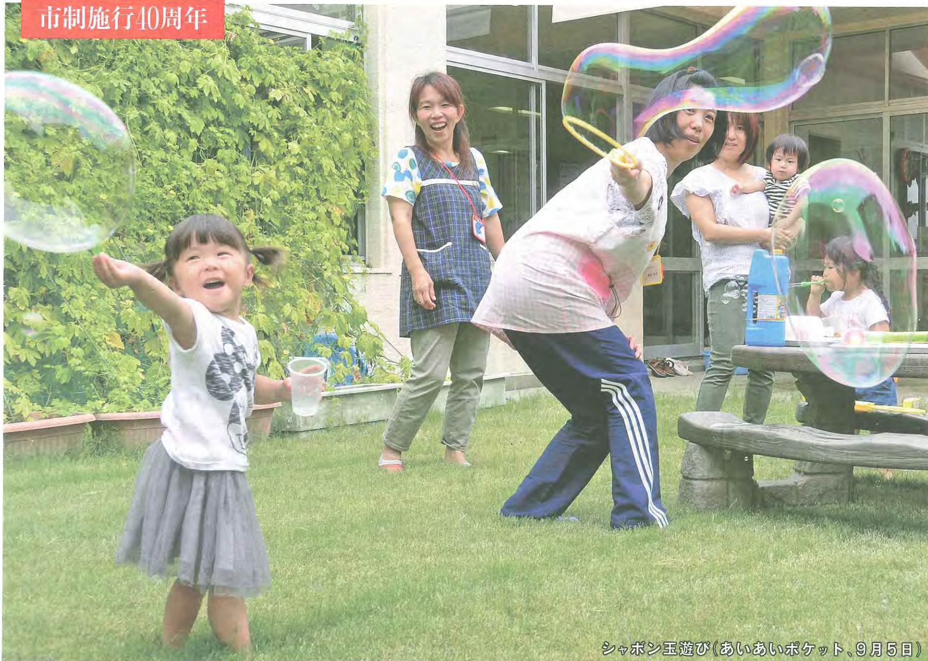
シャボン玉遊び(あいあいポケット、9月5日)