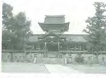
2 当時の石清水八幡宮 6 現在の石清水八幡宮

織田信長、豊臣秀吉、徳川家康―歴代の天下人たちを始め、多くの人から信仰を集めてきた石清水八幡宮。貞観元年(859年)に南都大仏の僧・行教が男山に八幡大神を勧請し、翌年(860年)、清和天皇により社殿が造営されました。現在の社殿は徳川三代将軍家光により造営されたもので、平成5年から実施されている平成の大修理など、幾度となく修理を重ね、町村合併や市制施行など八幡の歴史を見守りながら、今も多くの人に親しまれています。 織田信長、豊臣秀吉、徳川家康―歴代の天下人たちを始め、多くの人から信仰を集めてきた石清水八幡宮。貞観元年(859年)に南都大仏の僧・行教が男山に八幡大神を勧請し、翌年(860年)、清和天皇により社殿が造営されました。現在の社殿は徳川三代将軍家光により造営されたもので、平成5年から実施されている平成の大修理など、幾度となく修理を重ね、町村合併や市制施行など八幡の歴史を見守りながら、今も多くの人に親しまれています。