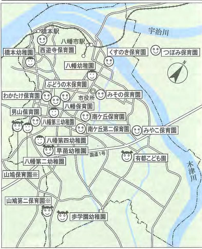
※山鳩保育園、山鳩第二保育園は平成30年4月に幼保連携型認定こども園に移行予定です。

【延長保育料】 延長保育料は、18時以降(八幡保育園・早苗幼稚園は18時30分以降)の保育に 【保育料について】 入園案内および市ホームページに、平成29年度の保育料を掲載しています。参考にご覧ください。