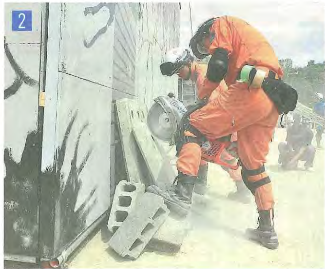
(写真右上から反時計回りに) 1土砂災害の被災者を救助する消防団員ら2カッターでがれきを除去する消防署員たち3避難所運営訓練の様子4倒壊ビルに向かって放水する消防団員たち(いずれも京都府総合防災訓練)