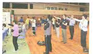
元気アップ！体操教室

なじみのある音楽を聴きながら、「体」だけではなく「頭」も使う音楽体操を体験してみませんか？ 子どもから高齢の人まで、幅広い世代のみなさんのご参加をお待ちしています。