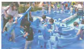
イマジネーションプレイグラウンド

日時 11月10日(金)・11日(土) 両日も午前10時~正午、午後1時30分~3時30分 場所 子ども・子育て支援センター すくすくの杜 対象 市内在住の就学前のお子さんとその保護者 定員 各日午前・午後、各75組 内容