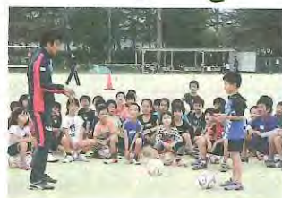
こどもボール遊び教室

京都サンガF.C.のスタッフさんと一緒に、ボールを使って遊ぶ遊びや簡単な運動を体験してみましょう。(参加申し込み終了)