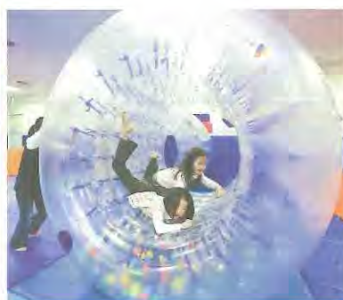
サイバーホイール