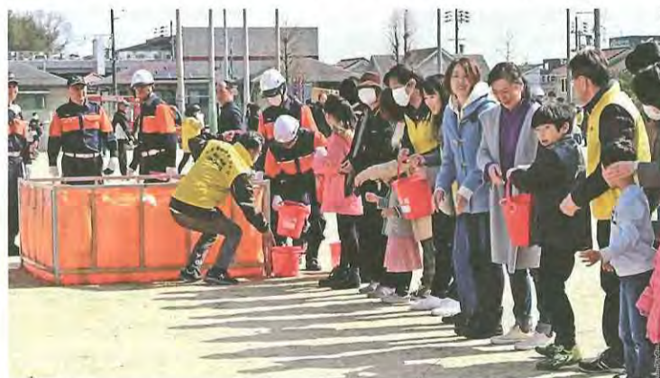
バケツリレーでの消火訓練を行う参加者(美濃山小学校)

同訓練は東南海・南海地震の発生を想定して実施され、各地区自治連合会が毎年主催しています。防災無線が対象地区に流れると、参加者たちは各地区の避難場所である、くすのき小学校と美濃山小学校に集合。その後、消防隊員や消防団員から消火器の取り扱いやAED(自動体外式除細動器)を使った応急処置、救助担架で負傷者を搬送する方法についての説明を受けました。