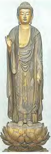
1 木造阿彌陀如来立像—左上—