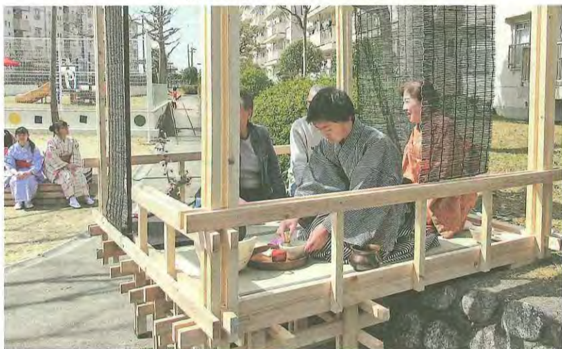
緑道に建てられた一坪茶室

このイベントは、同街道沿いの活性化を目的に、東高野街道八幡まちかど博物館協議会が主催。お店やお寺、施設など57カ所が協力し、ショーウィンドウなどに飾り付けました。平昌オリンピックにちなんでカーリングなどの競技を行う人形や、和菓子屋でもちつきをする人形など、来場者を楽しませるため、各所で最近の話題や場所に関連したシチュエーションを折り込んだ展示が行われました。