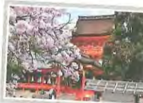
指定スポット 石清水八幡宮 およびその周辺