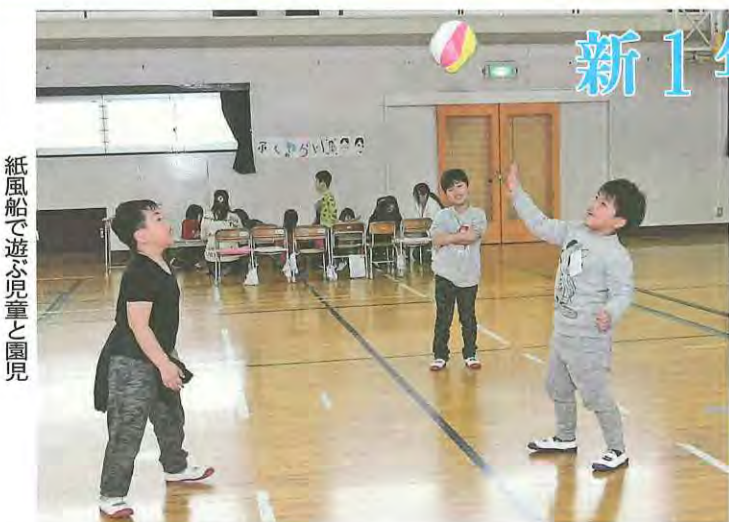
紙風船で遊ぶ児童と園児

最後に、1年生の代表委員が「今日は楽しかったですか。4月から待っています」とあいさつすると、園児たちは大きな声で返事し、4月からの小学校生活に期待を膨らませていました。