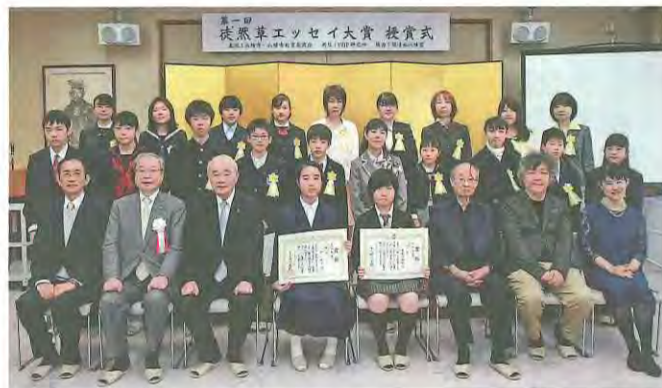
徒然草エッセイ大賞各賞受賞の皆さん

受賞作品等は専用ホームページ ( http://www.tsurezure-essay.jp )にて掲載しておりますので、ぜひご覧ください(市ホームページ内にリンクあり)。また、受賞作品を掲載した入選作品集を市民図書館に貸出用として設置してありますので、ぜひご覧ください。 ◆問い合わせ 社会教育課