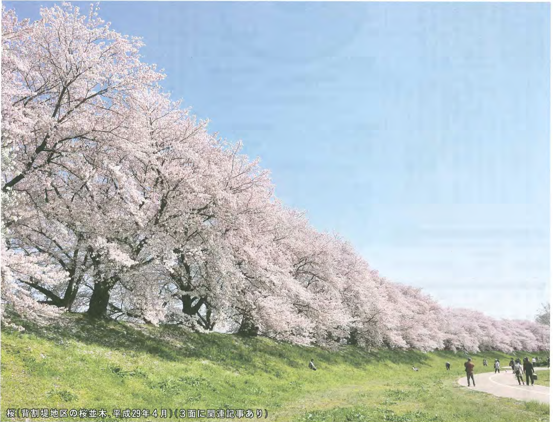
桜(背割堤地区の桜並木、平成29年4月)(3面に関連記事あり)