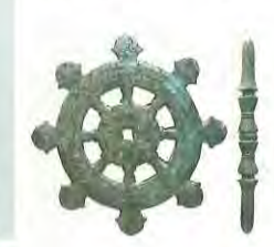
2 石清水八幡宮境内出土品—右上—