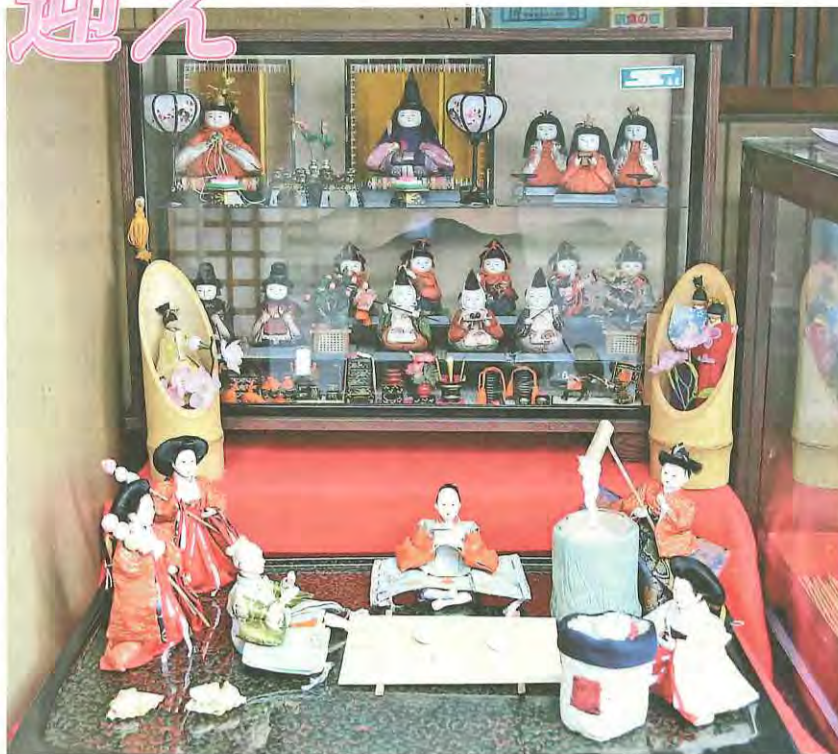
和菓子屋で飾られるもちつきなどをするひな人形

3月3日～11日に「第7回八幡まちかど雛まつり」が開催され、八幡市駅前観光案内所から松花堂庭園・美術館までの東高野街道沿いがひな人形で彩られました。