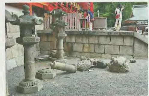
本殿前の石灯籠が倒壊(石清水八幡宮)