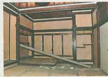
かもいが落下した「泉坊書院」(松花堂庭園)

▼国指定の重要文化財の伊佐家住宅の主屋などの壁が損傷。 ▼国指定の重要文化財の正法寺の大方丈の壁が損傷。 ▼国登録の有形文化財の中村家住宅大歌堂の書院で天井の鏡板が外れるなど。 ▼府指定の有形文化財の善法律寺の本堂の壁が損傷。