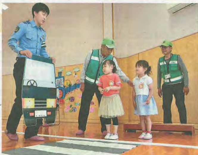
横断歩道で車の確認をする園児たち

この教室は、園児たちに安全な横断歩道の渡り方などを学んでもらおうと、交通安全対策協議会、八幡警察署の協力を得て実施されました。