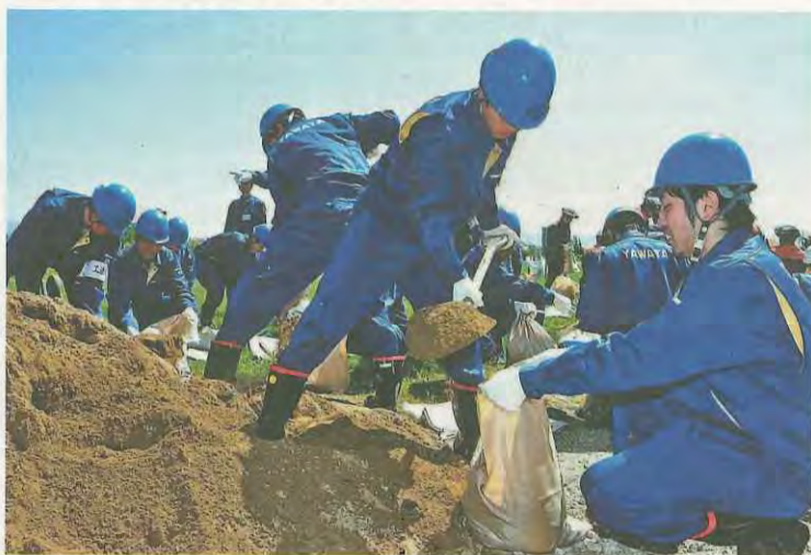
土のうを作製する参加者たち

同訓練は、住民の生命身体および財産を守るため、水防工法の基礎的技術の習得と水防体制の強化を図ることを目的に、毎年実施されています。約170人の参加者は7小隊に分かれ、6小隊が水防工法訓練、女性防火推進隊によ