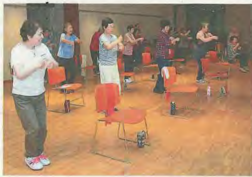
「元気アップ体操教室」で体を動かす参加者たち

な」と思っていたところに、健康について教えてくださるという案内を見て、絶対に行きたいと思いました。