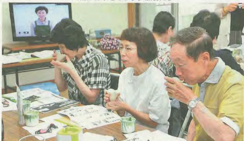
八幡のお茶を味わう参加者たち