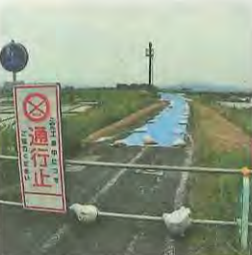
通行止めになった木津川サイクリングロード

●地震の被害にあわれた皆さんへ り災証明書を発行 市では、地震等の原因による建物や家財等の被害に対し、「り災証明書」を発行します。り災証明書はご自身が加入している保険会社への請求等に必要となる場合があります。まだ申請がお済みでない人は、防災安全課へご相談ください。