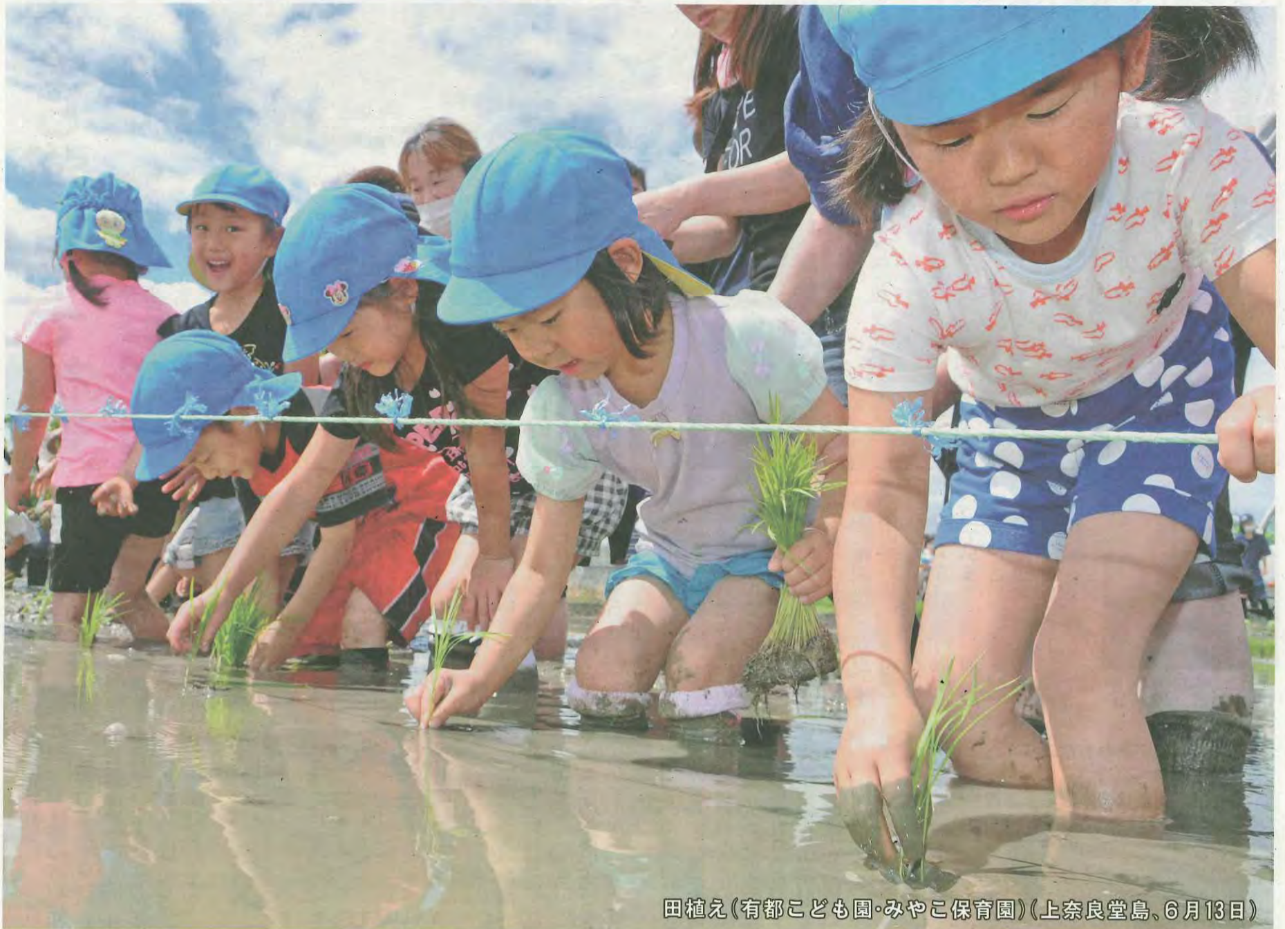
田植え(有都こども園・みやこ保育園)(上奈良堂島、6月13日)