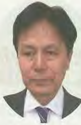
◆問い合わせ 財政課

補正予算案は、平成30年度の一般会計予算に1億1千701万円を追加し、補正後の歳入歳出予算の総額を243億5千701万円としました。