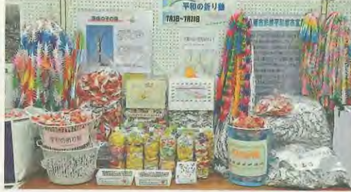
昨年寄せられた折り鶴

示した後、市内中学生らの平和大使により8月6日(月)、広島平和記念公園の「原爆の子の像」にさげられます。