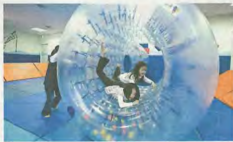
サイバーホイール

日時 11月9日(金)・10日(土) 両日とも午前10時～正午、午後1時30分～3時30分 場所 子育て支援センター あいあいポケット 対象 市内在住の就学前のお子さんとその保護者 定員 各日午前・午後、各50組