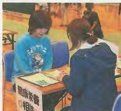
健康チェック & 健康栄養相談