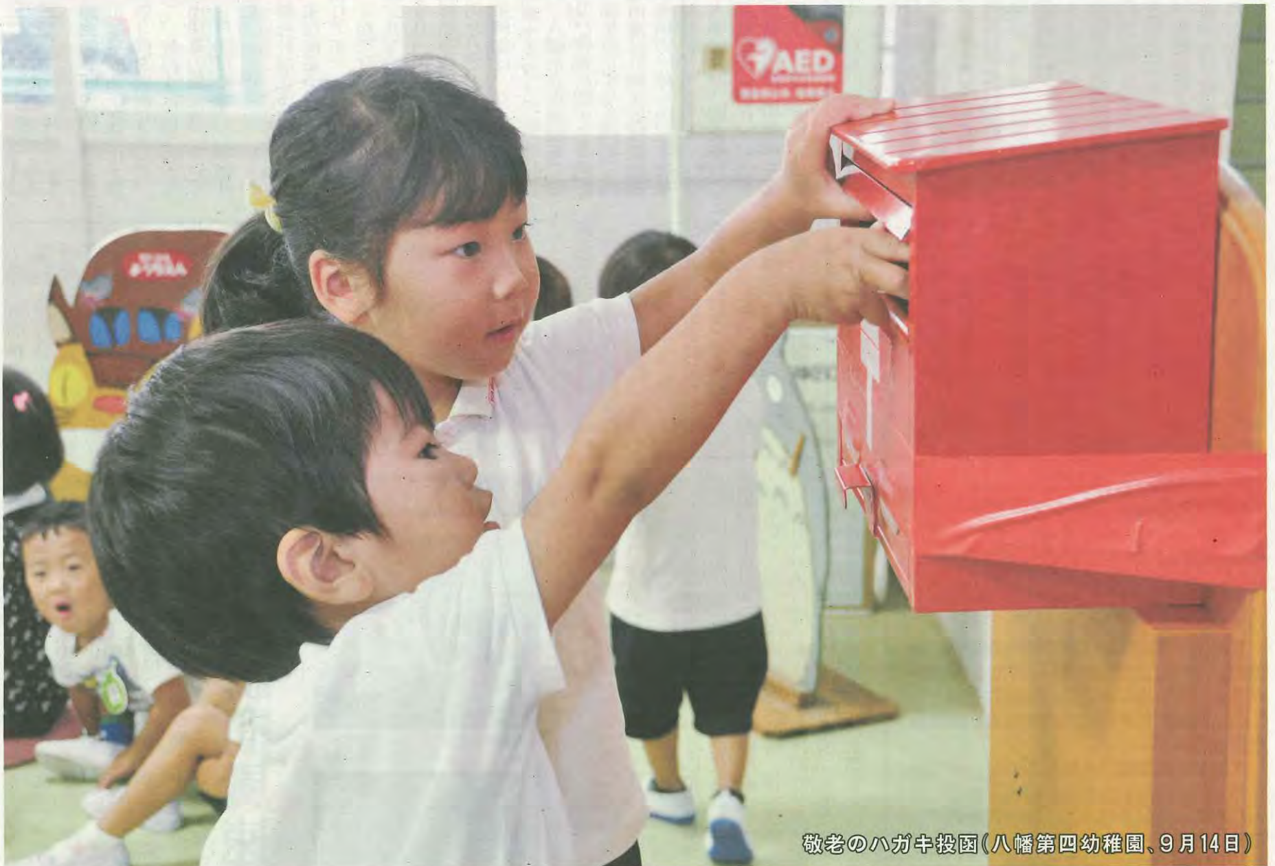
敬老のハガキ投函(八幡第四幼稚園、9月14日)