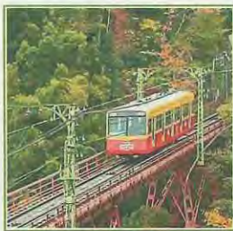
男山ケーブル ▲ 新・空中茶室「そら」▶

日時 10月21日(日) 【昼の部】午後1時30分～6時 【夜の部】午後6時30分～ 場所 石清水八幡宮境内、男山ケーブル