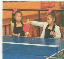
卓球ストラックアウト