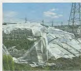
倒壊したビニールハウス