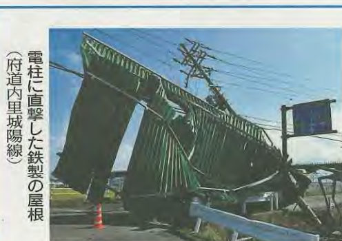
電柱に直撃した鉄製の屋根(府道内里城陽線)

最大瞬間風速49.2m(消防本部計測)を記録した台風21号により、瓦など家屋の損壊236件、電柱の倒壊等による停電や府道2力所の通行止め、人的被害4件等、市内で大きな被害を受けました。