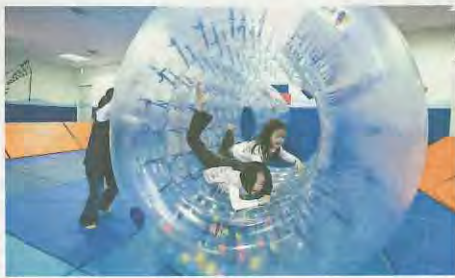
サイバーホイール

日時 11月9日(金)・10日(土) 両日とも午前10時～正午、午後1時30分～3時30分 場所 子育て支援センター あいあいポケット 対象 市内在住の就学前のお子さんとその保護者 定員 各日午前・午後、各50組