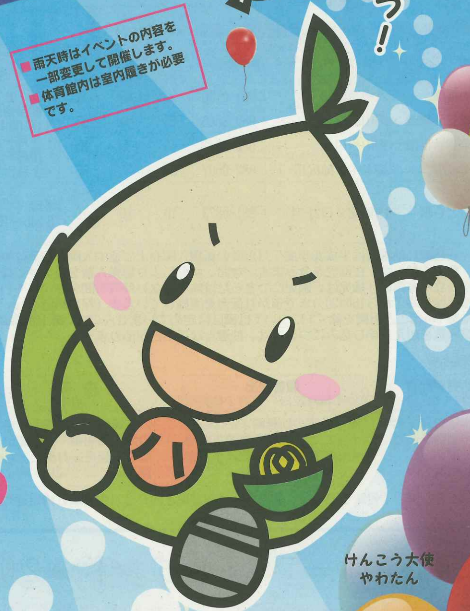
けんこう大使 やわたん