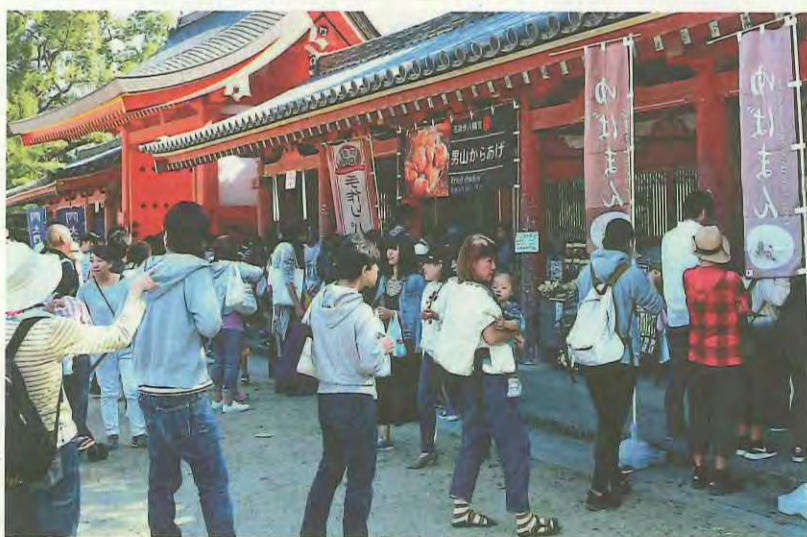
各地の「うまいもん」が集結し、たくさんの人でにぎわう会場

八幡や淀川沿川などの「うまいもん」が一堂に集まる「やわたうまいもん祭&マルシェ」が10月21日、石清水八幡宮頓宮で開催され、約6500人の来場者でにぎわいました。