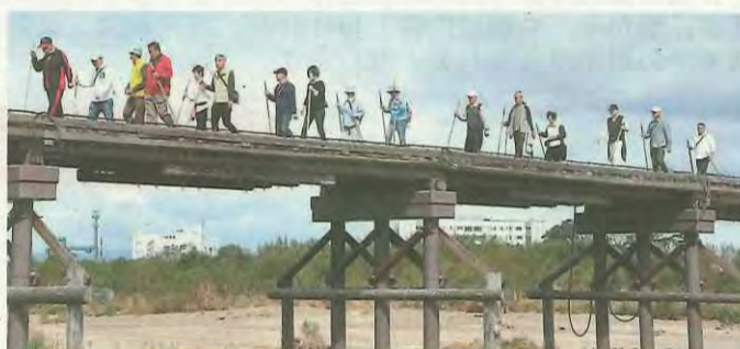
流れ橋をウォーキングする参加者たち

にも、体操教室や健康づくりに取り組んでポイントを貯める「健康マイレージ事業」など、さまざまな健康事業を実施しています。また、来年3月には生涯学習センターで、ロコモチェックや筋トレなどの体験を通じて、「健幸」に暮らすための気付きを得る「健幸マルシェ」の開催も予定しています。