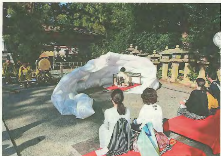
新・空中茶室「そら」でのお点前に見入る参加者たち

このページでは、市民の皆さんの活躍やまちの話題などを紹介しています。身近な話題や、広報紙についての意見を、秘書広報課までお寄せください。