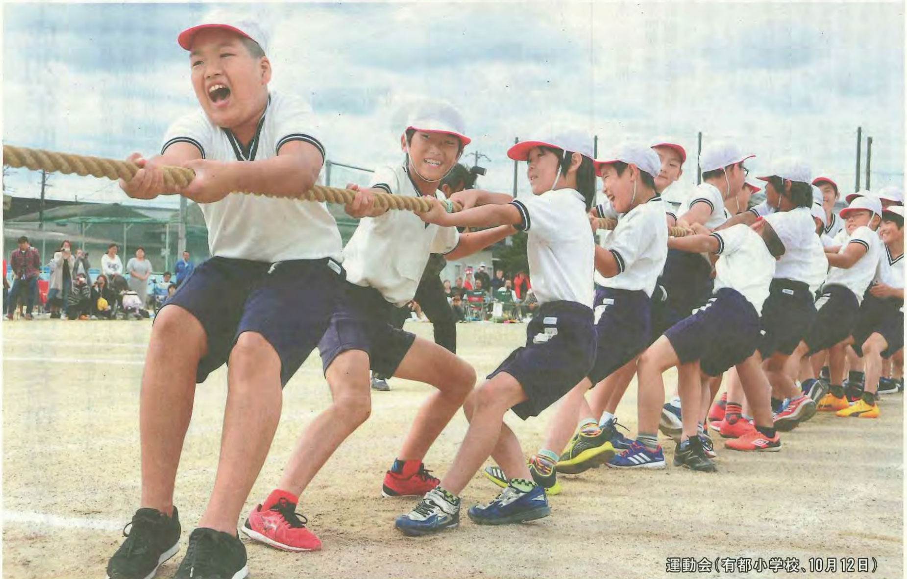
運動会(有都小学校、10月12日)