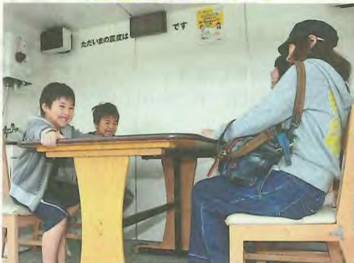
地震体験をする親子連れ

同会場では、消防本部の発足50周年を記念したイベントも同時開催。参加者たちは、地震や濃煙の体験、初期消火訓練など、さまざまな消防プログラムも楽しんでいました。