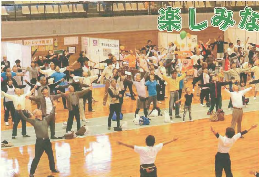
全員でラジオ体操をする参加者たち

健康づくりの祭典「健康フェスタ2018」が10月20日、市民スポーツ公園・市民体育館で開催され、約2200人の参加者がさまざまな健康プログラムを楽しみました。