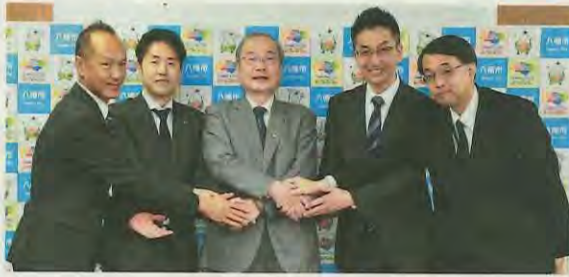
協定を締結した、スポーツクラブ各社の代表者と市長

本市では、市民が健やかで幸せに暮らせるまち「スマートウェルネスシティ」の構築を目指し、市民の健康づくりに取り組んでいまして、その一環として、11月26日(月)、本市と市内および市近郊のスポーツクラブ5社と「やわた健幸づくり推進連携協定」を締結しました。