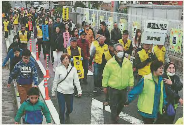
プラカードを掲げる参加者たち

「安全・安心のまちづくり」パレードが11月23日、美濃山小学校を拠点に開催され、約1000人の参加者が、防犯を呼び掛けるプラカードを掲げるなどしながら地域を行進しました。