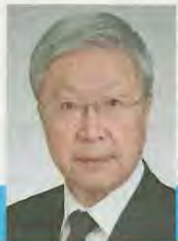
坂元 茂樹さん寄稿

2011(平成23)年3月11日に発生した東日本大震災後、政府は2012(平成24)年と2013(平成25)年に「災害対策基本法」を改正し、地方自治体に緊急時の避難場所と区別して、被災者が一定期間滞在する避難所について、その生活環境などを確保するための一定の基準を満たす施設をあらかじめ指定するとともに、高齢者や障がいのある人など災害時の避難に特に配慮を要する人たちについて本人の同意を得て名簿を作成し、消防や民生委員にあらかじめ情報提供をよう求めています。