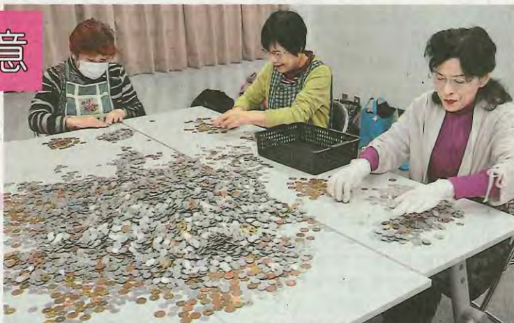
硬貨などを仕分ける女性会員たち

この活動は、「1日1円」を合言葉に市の福祉に役立てようと、同連合会が昭和56年から毎年実施。今年の2月に約5千個の貯金箱を会員に配布し、買い物のお釣りなどを貯金してきました。