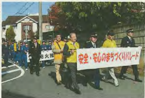
市自治連合会主催の「安全・安心のまちづくり」パレード

③市民サービスの提供 市民サービスの提供にあたっては、地方自治法の趣旨を踏まえ、「住民の福祉の増進を図る」という効果への視点と「最少の経費で最大の効果を挙げる」という効率への視点が重要である。