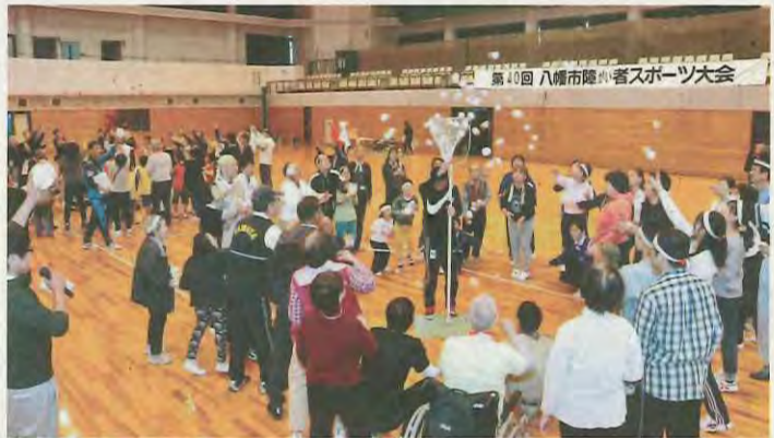
玉入れをする参加者たち

このページでは、市民の皆さんの活躍やまちの話題などを紹介しています。身近な話題や、広報紙についての意見を、秘書広報課までお寄せください。