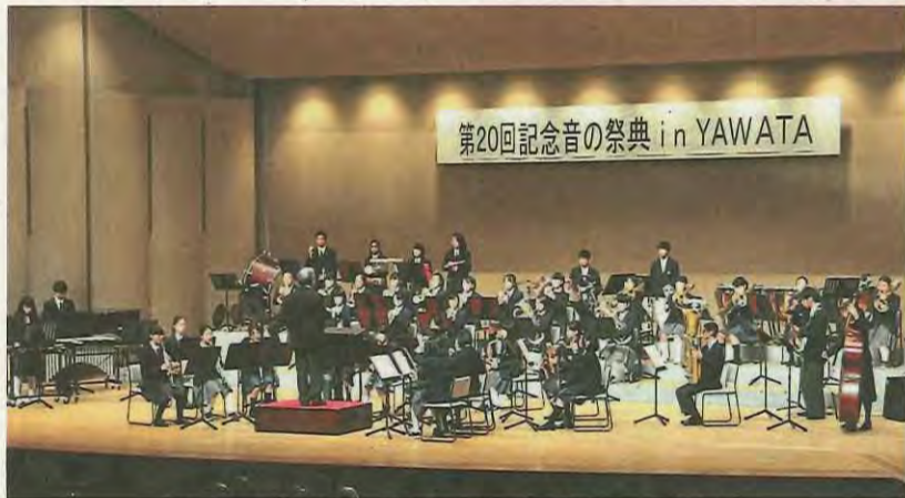
演奏する市内中学校・京都八幡高校合同バンド

「第20回記念音の祭典 in YAWATA」が11月11日、文化センター大ホールで開催され、約750人の観客が、出演した11組の演奏を楽しみました。