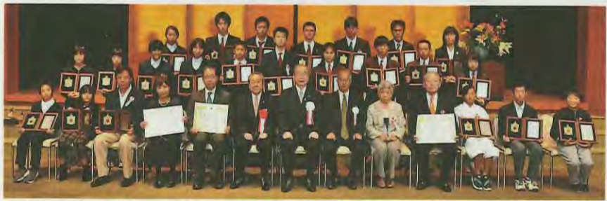
文化賞、スポーツ賞受賞の皆さん