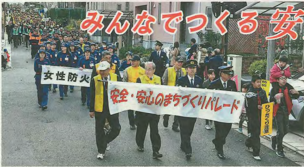
横断幕を掲げて行進する参加者たち