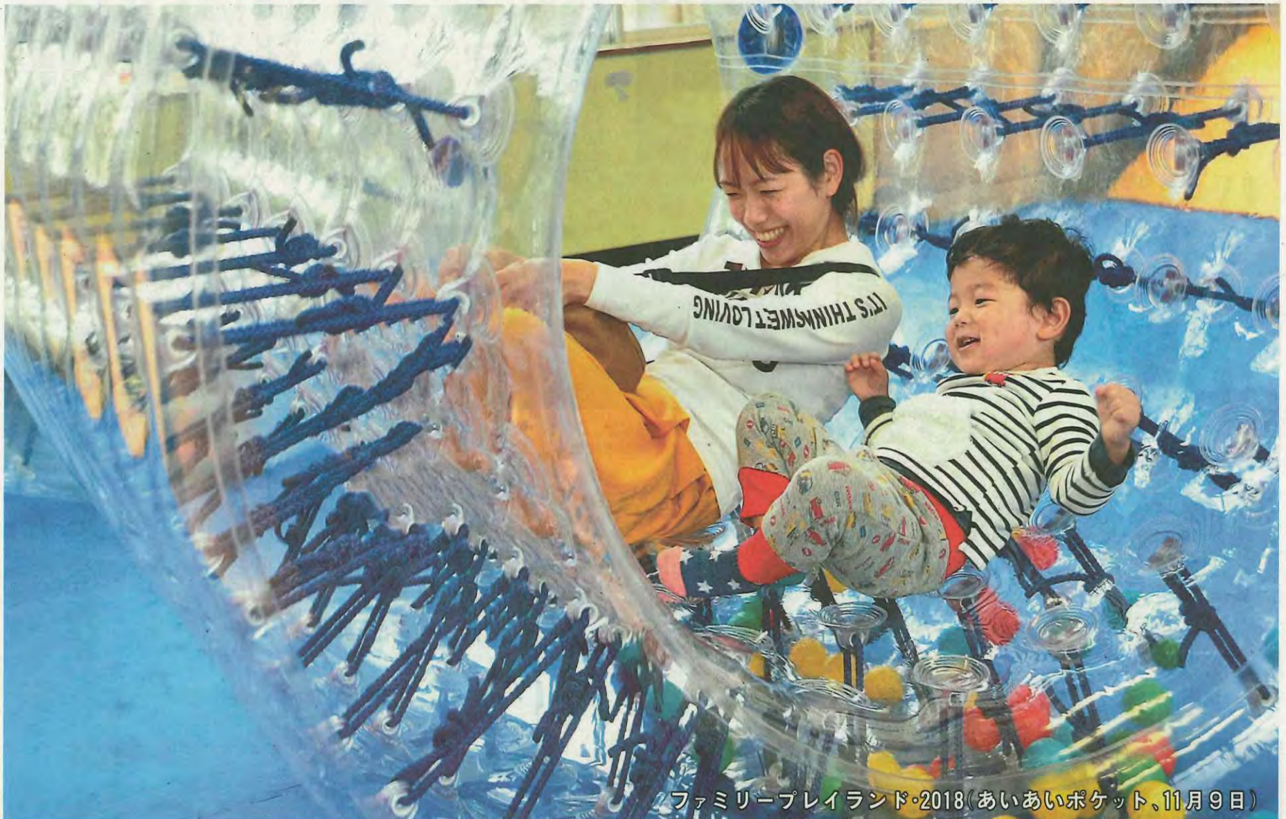
ファミリープレイランド・2018(あいあいポケット、11月9日)