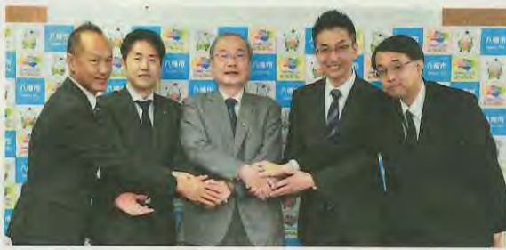
協定を締結した、スポーツクラブ各社の代表者と市長

本市では、市民が健やかで幸せに暮らせるまち「スマートウェルネスシティ」の構築を目指し、市民の健康づくりに取り組んでいきます。その一環として、11月26日(月)、本市と市内および市近郊のスポーツクラブ5社と「やわた健幸づくり推進連携協定」を締結しました。