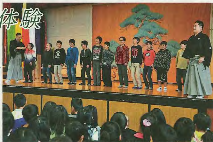
「笑い」を体験する児童たち

公演では草風会の能楽師たちが、柿を盗み食する山伏と柿畑の持ち主とのやりとりを描いた狂言「柿山伏」、漁師から羽衣を返してもらったお礼に天人が舞楽を舞う能「羽衣」を上演。