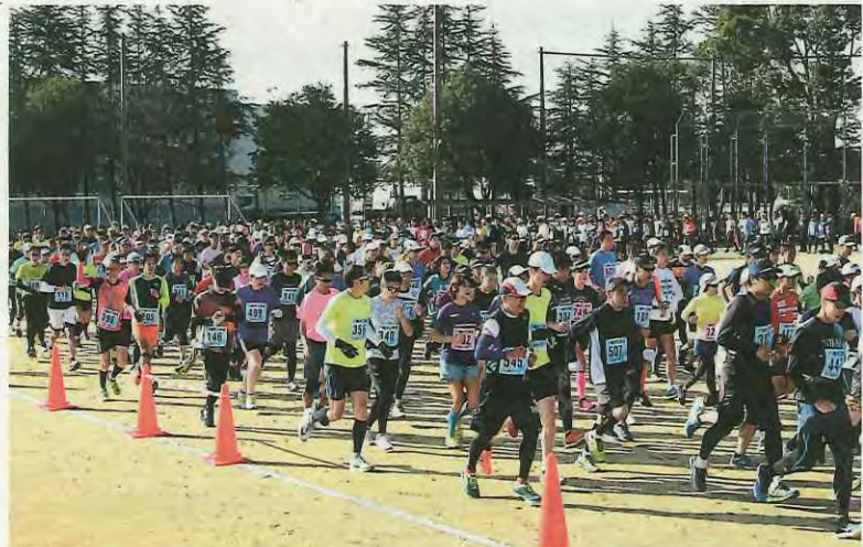
スタートを切るランナーたち

大会を終えて、「はじめの全国高校駅伝は楽しかったです。次こそは優勝と区間賞を目指したい」と梓選手。環選手は「先輩に負けないように初心を忘れずに努力し、次は優勝したいです」と話していました。