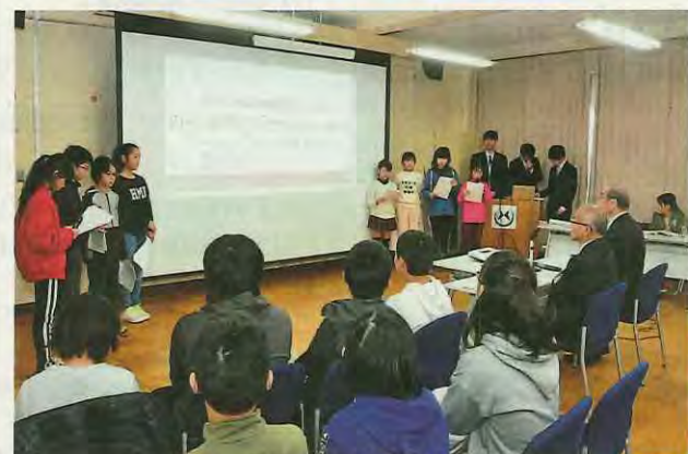
市長にアイデアを提言する小学生班

班は、啓発用のオリジナル動画やポスターを制作。子どもから防災について発信し、市民の意識を高めることを提言しました。ほかにも、オリジナル松花堂弁当を作るイベントや八幡市産の抹茶を使ったいろいろな作り、国籍を超えたスポーツ大会の開催など、さまざまなアイデアが提言されました。