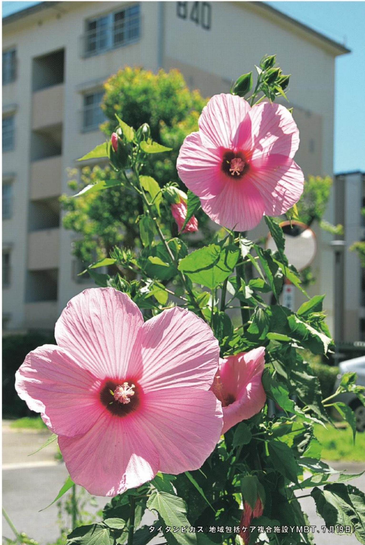
タイタンピカス(地域包括ケア複合施設YMBT、7月19日)

情報ひろば(市政、イベント、募集、講座・教室) 相談、年金、短信、生活、図書館 保健医療(健康診査・相談、予防接種、がん検診ほか) まちの話(旅する♡拓本、保育園太鼓まつり、ダンスフェスティバルin YAWATA、今月のこの人) 6・7面 8・9面 10・11面 12面