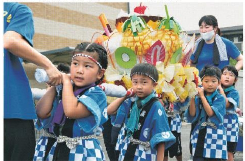
町内を練り歩く南ヶ丘保育園の園児たち

お揃いの法被を着た園児たちは、みんなの好きな食べ物や歌をテーマに作ったかわいらしい屋形太鼓を担いで、それぞれの園を出発。「ヨッサー、ヨッサー」と元気に掛け声をあげながら練り歩く様子に、応援に駆け付けた地域の人たちは笑顔でいっぱい。両園の屋形太鼓が集結すると、ここぞとばかりに声を張り上げ、屋形太鼓を大きく揺らす園児たち。暑さにも負けず一生懸命な勇ましい姿に、周囲からは大きな拍手が起りました。