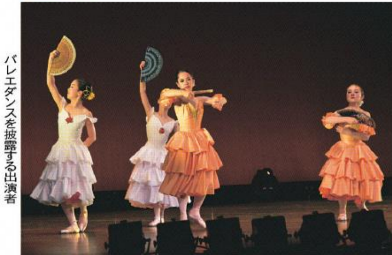
バレエダンスを披露する出演者

ツズグループは、カッコいい振付のダンスを一生懸命踊り、会場を盛り上げました。また、立ち位置を入れ替えるながらダイナミックな振付を繰り出すヒップホップダンスや、舞踏会での恋模様をコミカルに表現したバレエなど、この日に向けて練習してきた演目が披露されるたび、観客からは惜しめない拍手が送られています。