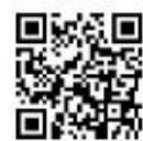
介護保険制度パンフレット