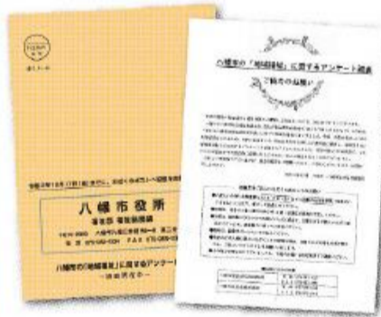
郵送する封筒とアンケート用紙(イメージ)

市と社会福祉協議会が協働して、令和5年度から令和9年度を計画期間とする「第3次八幡市地域福祉推進計画」の策定を進めています。 そこで、本計画の基礎資料とするため、無作為に抽出した18歳以上の市民2千人を対象に、地域福祉に関するアンケート調査票を11月30日(火)から順次郵送いたします。 なお、回答時間は15分程度で、アンケートの回答に関し、個人が特定されることはありません。届いた場合は、回答にご協力をお願いいたします。