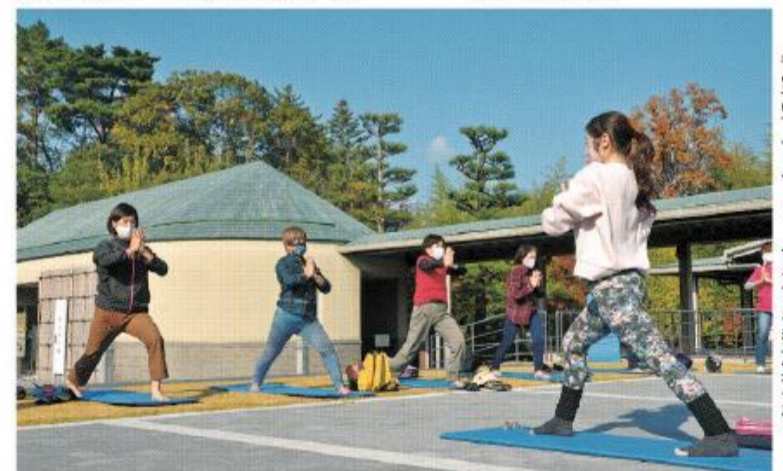
青空の下でストレッチをする参加者たち