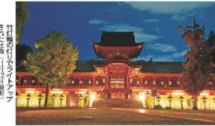
竹灯籠の灯りでライトアップされた社殿(11月12日撮影)

このページでは、市民の皆さんの活躍やまちの話題などを紹介しています。身近な話題や、広報紙についての意見を、秘書広報課までお寄せください。