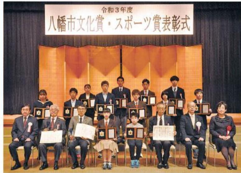
文化賞・スポーツ賞 受賞の皆さん

11月3日(水・祝)、文化やスポーツの各分野で活躍された人や団体を文化センターで表彰しました。長年にわたり文化やスポーツの振興・発展に貢献された1人2団体が功労賞を受賞。また、昨年9月から今年8月までに文化やスポーツの大会等で優秀な成績を収めた13人1団体が、各賞を受賞されました。