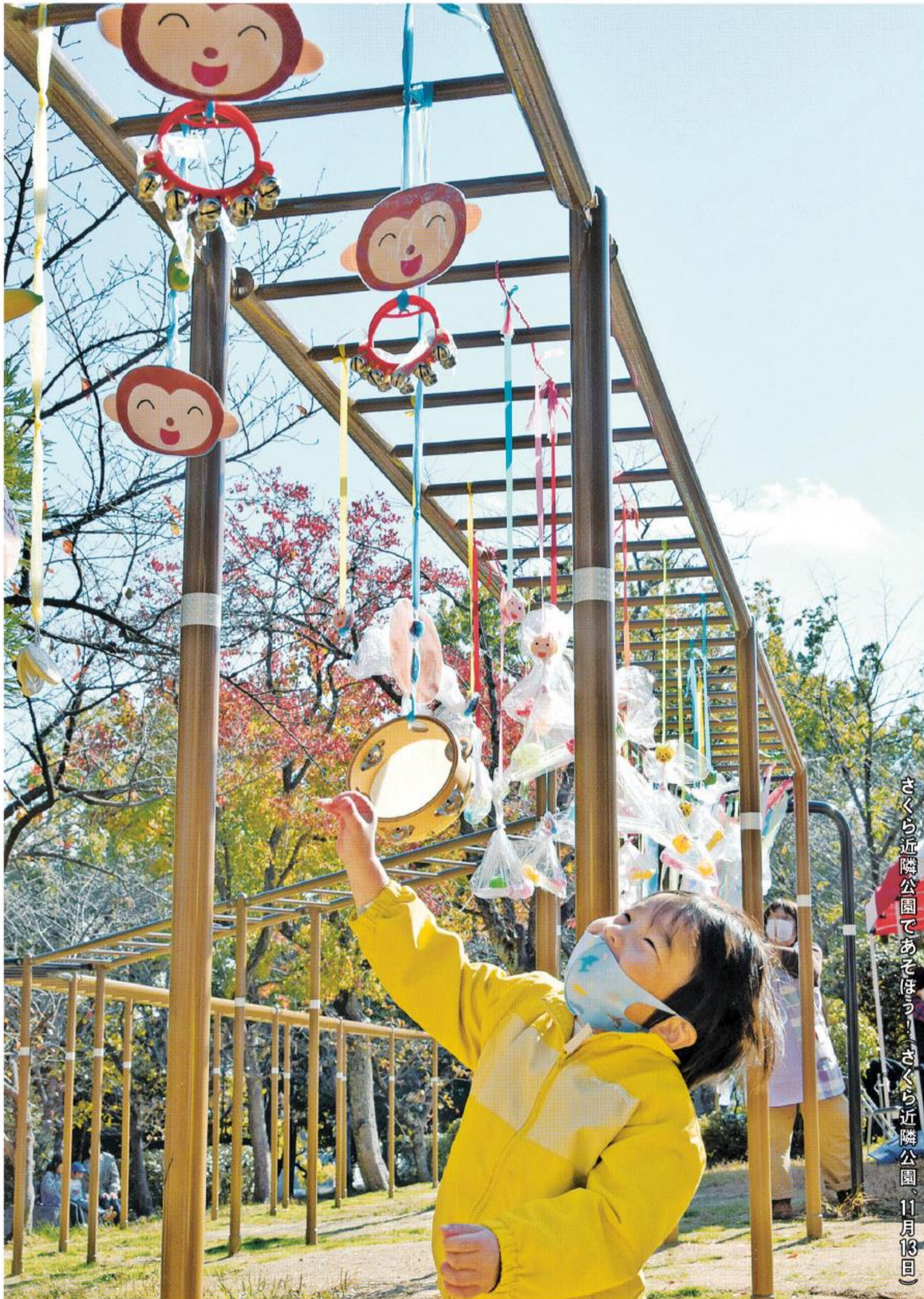
さくら近隣公園であそぼうー(さくら近隣公園、11月13日)