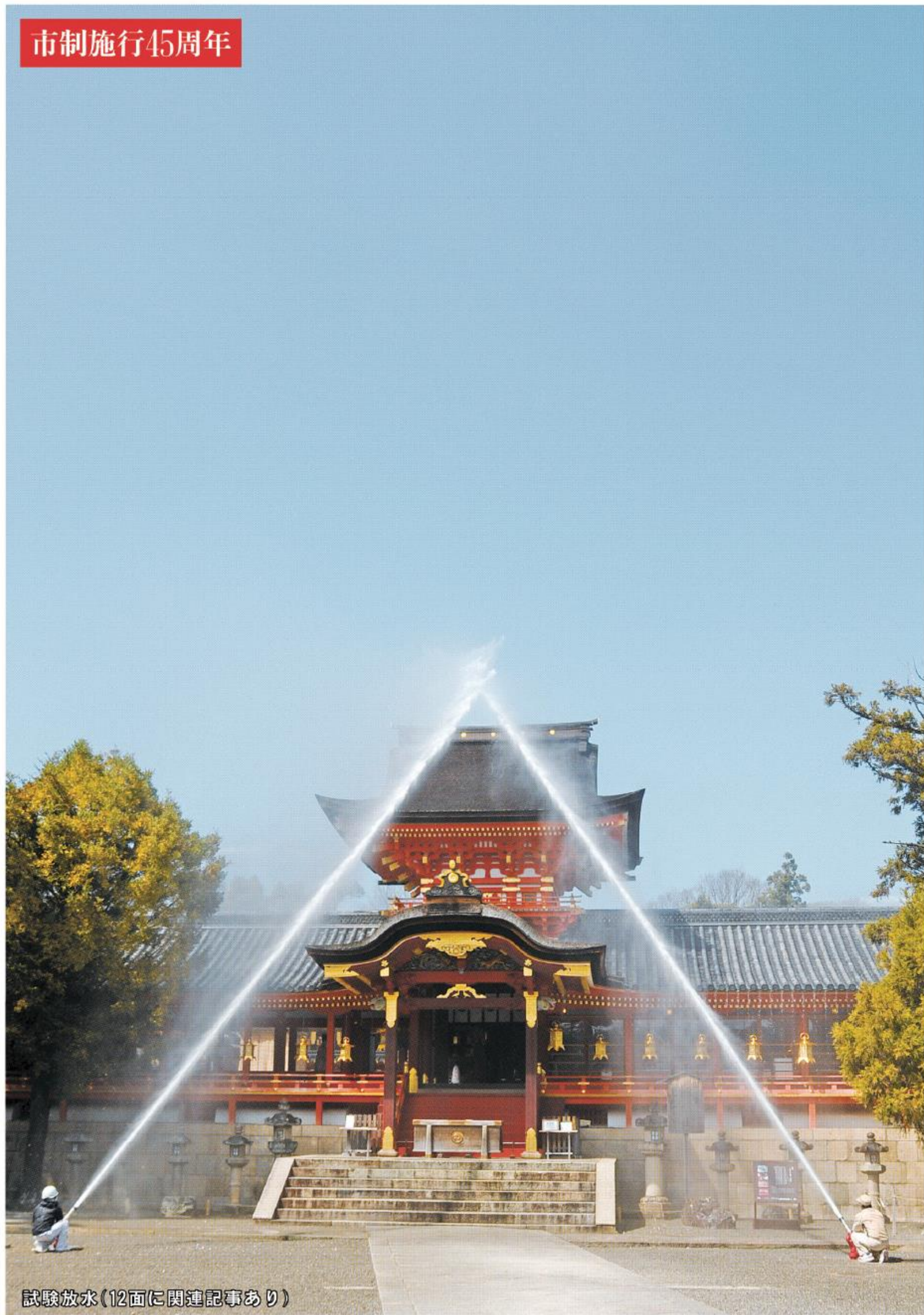
試験放水(12面に関連記事あり)