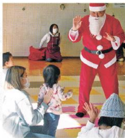
こどもすくすくひろばでの活動風景(令和3年12月2日撮影)

対応がとれるように、市や関係機関との連絡調整 【その他】各種証明書などの取扱業務の紹介や、行政や社会福祉協議会などが実施する諸活動(要援護者の見守りなど)への協力 お気軽に相談ください 各委員は市民の皆さんの身近な相談役として、困りごとに応じた助言を行うほか、市役所の担当部署へのパイプ役を務め、解決のお手伝いをします。 地域ごとに担当の委員が決まっていますので、委員