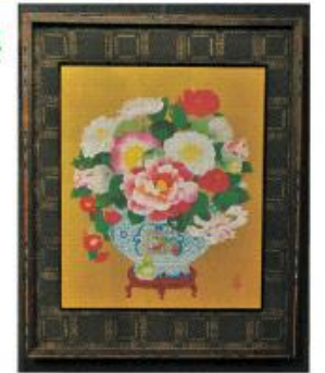
同展のために書き下ろした作品「八椿堂」

成17年に同館で個展を開催した縁から、松花堂庭園で有名なツバキをモチーフに書き下ろした作品「八椿堂」も披露されるなどし、来館者は足を止めて田島作品の幅広い世界観に触れていました。