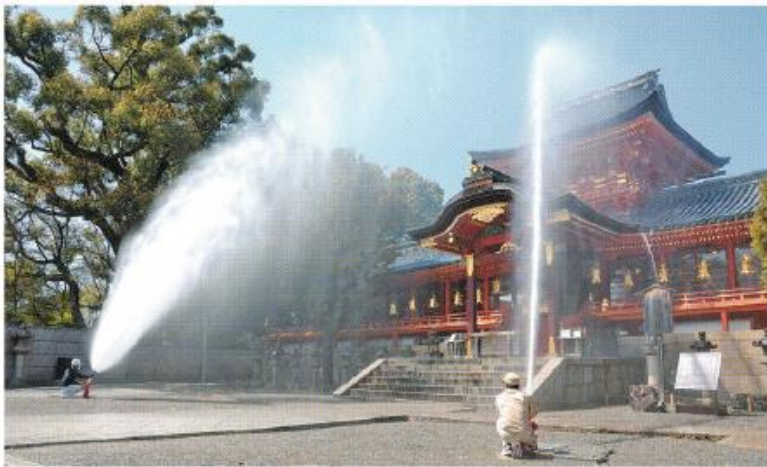
▲石清水八幡宮本社への試験放水