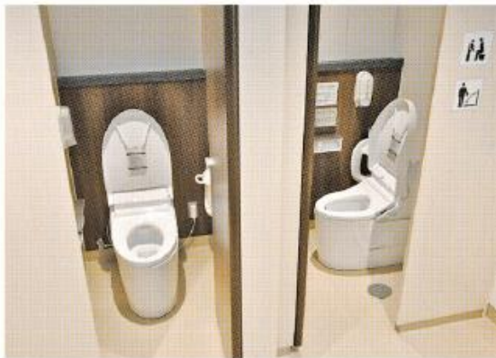
①和式トイレを洋式トイレに改修 ②機能が充実した多目的トイレ

衛生環境の改善を図るため、文化センター大ホール(1階部分)および小ホール(4階)などのトイレや多目的トイレの改修工事を実施しました。 主な改修内容として、新型コロナウイルスなどの感染予防の観点から、洗面化粧台にはセンサーに手をかざすだけで水が出る非接触式の水栓を設置。さらには、トイレの乾式化・洋式化、トイレスペースの増設、幼児用設備やオストメイト対応設備の設置などです。 今年度は文化センター2階と3階のトイレ改修を予定しております。引き続き、不便をおかけいたしますが、ご理解・ご協力の程お願いいたします。