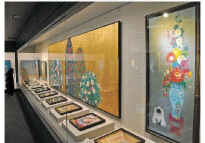
松花堂美術館で日本画展 8日まで