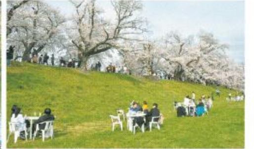
①桜を見ながら食事を楽しむ「さくらビュープレミアムシート」利用者 ②宇治川を下る「さくらであいクルーズ」