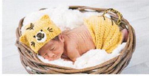
しもかど そら 下角 蒼空くん(0歳)