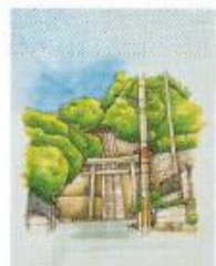
狩尾神社本殿へ続く鳥居と階段を描いたイラスト

イラストレーターやグラフィックデザイナーとして活動しながら、生まれ育った橋本のまちを描いた「はしもと帖」を制作。岡山第三中学校、京都八幡高校出身。