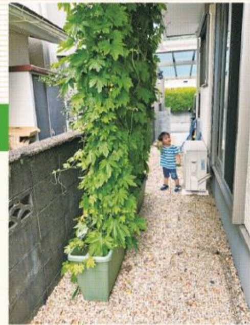
令和3年度写真コンテスト大賞作品