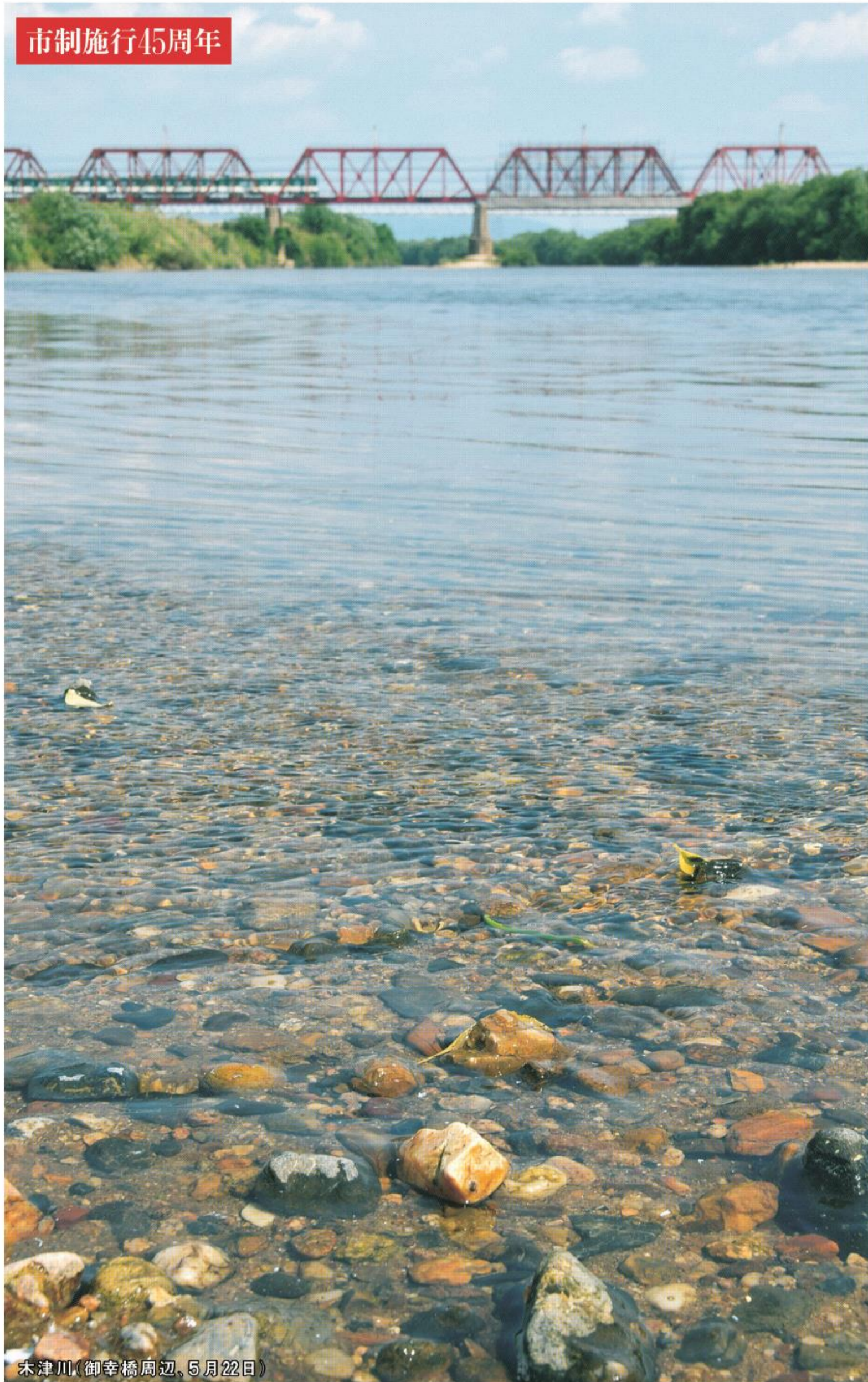
木津川(御幸橋周辺、5月22日)