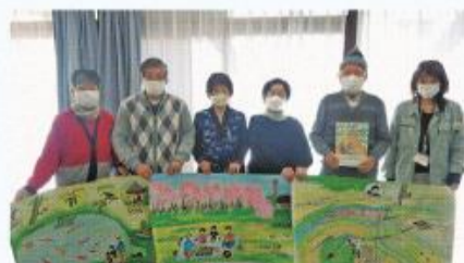
環境教育絵本を作成した八幡市環境市民ネットの会員たち

●活動内容 月1回の会議で会員同士の話し合いで決定しています。現在は、グリーンカーテンやマイバッグの普及啓発活動や、幼稚園・保育園で大型紙芝居を使った環境啓発などを行っています。