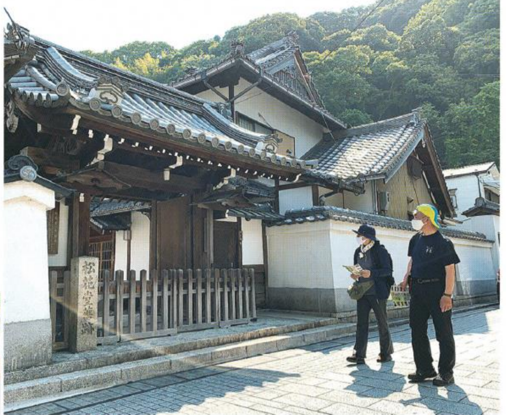
①泰勝寺前の石畳を歩く参加者 ②ゴールの松花堂庭園・美術館で記念品を受け取る参加者