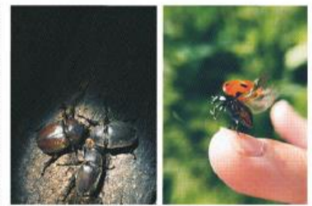
昨年度の大賞作品