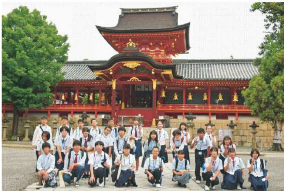
写真上＝清水八幡宮の前で記念撮影をする生徒 同右＝竹あかりを制作する生徒 同左＝竹あかりのライトアップの様子

このほか、忠八が創建した飛行神社などを訪問し、本市の歴史や文化を勉強。松花堂では、茶室でのお茶席体験やNPO法人八幡たけくらぶの指導のもと、竹からあかりがもれるよう電動ドリルで穴を開けて竹あかりを制作。広場に並べた竹あかりを夕暮れにライトアップすると、周囲が幻想的な光に包まれ、生徒たちは風情ある光景を楽しみながら交流会の感想などを話していました。