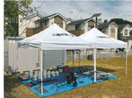
第一区が購入した物品