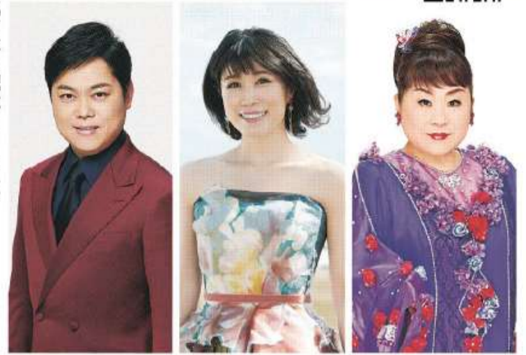
三山ひろし 水森かおり 天童よしみ