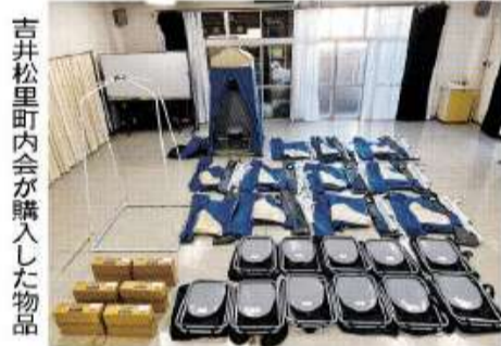
吉井松里町内会が購入した物品

福祿谷自治会ではテント、机、イス等を、八幡市第一区および八幡市第五区では倉庫、テント、発電機等の防災資機材や防災用品の整備を行いました。