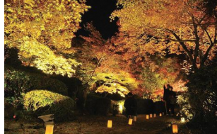
昨年の善法律寺の ライトアップ

文化財一斉公開期間中、同寺の境内が、午後5時30分~8時にライトアップ。夜の闇に艶やかに浮かび上がる紅葉をご堪能ください。※参加無料。本堂への拝観は別途、拝観料が必要。