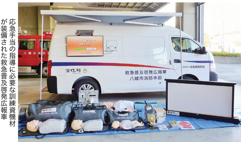
応急手当の指導に必要な訓練資機材が装備された救急普及啓発広報車