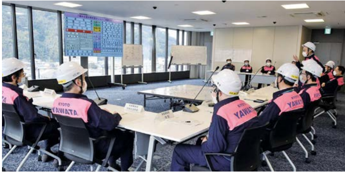
災害対策本部会議の講評の様子

地震発生と同時に、市役所5階に災害対策本部を開設。本部事務局のほか、応急対策部など5つの部を設け、訓練想定に基づいて、負傷者、建物や道路の損壊、土砂崩れなどの被害情報の収集を行いました。 収集した情報を市幹部に伝達し、災害対策本部会議で共有。被害状況の確認や必要な行動の整理を行い、人命救助を第一に、市民に安全確保の呼びかけを行うよう指示が出されました。 このほか、訓練時の疑問や改善点についての意見交換を行うなどして、有事の際に備えました。