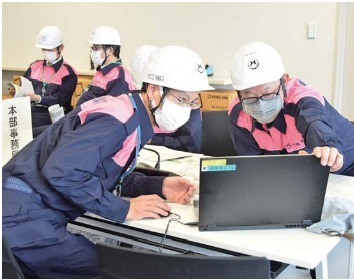
災害時の連絡体制を確認する市職員