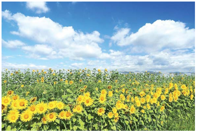
写真は今年度にインスタグラムでハッシュタグ「#やわふおと」をつけて投稿された作品です。