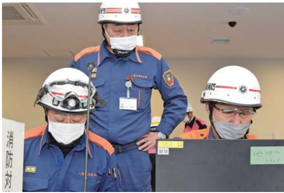
被害状況を確認する消防職員

同訓練は、和歌山県沖でM8・2の地震が発生し、市内でも大規模な災害が生じた場面を想定して実施しました。