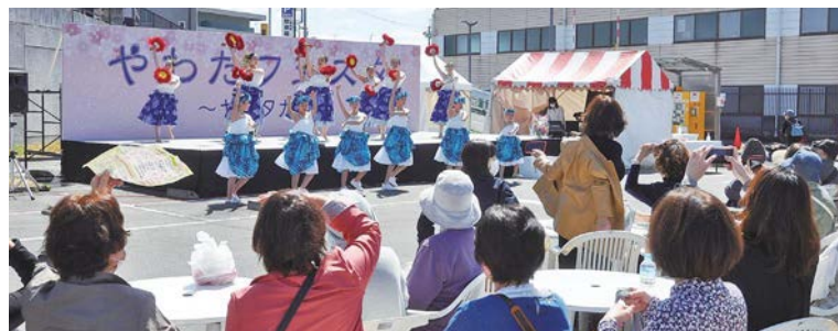
昨年のやわたフェスタの様子