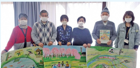
▲八幡市環境市民ネットの会員たち

●活動内容 月1回の会議で会員同士の話し合いで決定しています。昨年度は、グリーンカーテンの苗配付会や幼稚園・保育園で大型紙芝居を使った環境教育などを行いました。