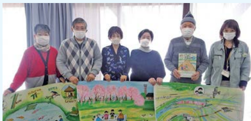
▲八幡市環境市民ネットの会員たち

●活動内容 月1回の会議で会員同士の話し合いで決定しています。昨年度は、グリーンカーテンの苗配付会や幼稚園・保育園で大型紙芝居を使った環境教育などを行いました。