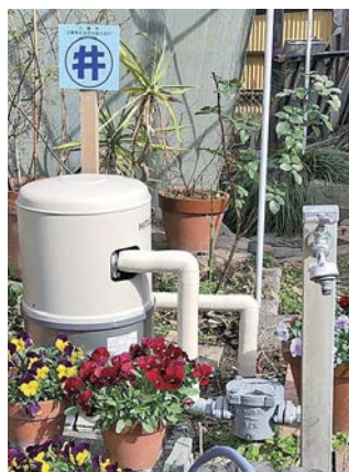
(右から時計回り)登録井戸の標識と、標識の設置例

登録要件 1 生活用水として使用可能な水量・水質であること 2 井戸水をくみ上げるための設備があること 3 災害などの断水時に無償で近隣住民に井戸水を提供していただけること 4 井戸枠などがあり安全であること 5 井戸の所在地の公表を了承していただけること 登録方法 所定の用紙(危機管理課窓口または市ホームページから入手可)を危機管理課に持参。 ※必要な場合は、市が水質検査を実施します。 ※登録井戸には標識をお渡ししますので、見える場所に設置をしてください。