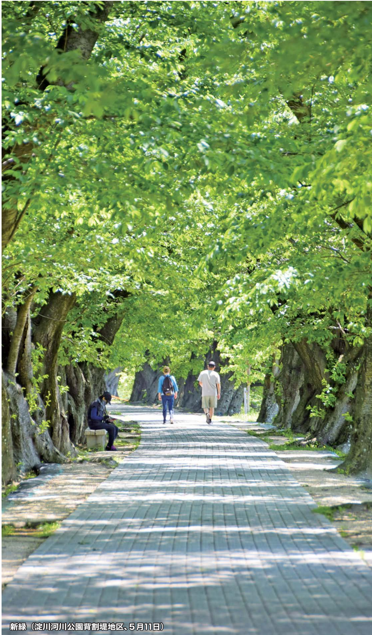
新緑 (淀川河川公園背割堤地区、5月11日)