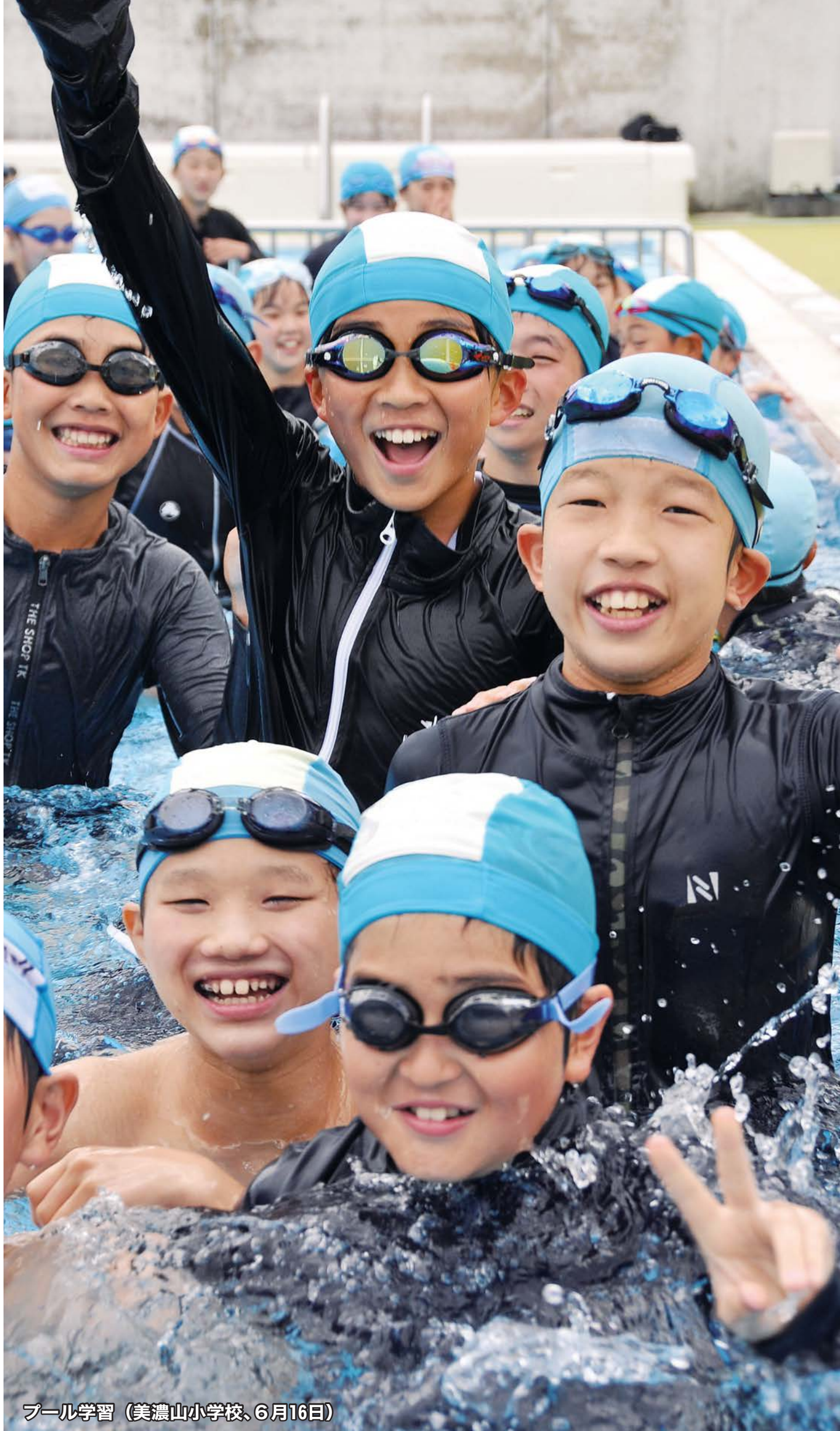
プール学習 (美濃山小学校、6月16日)