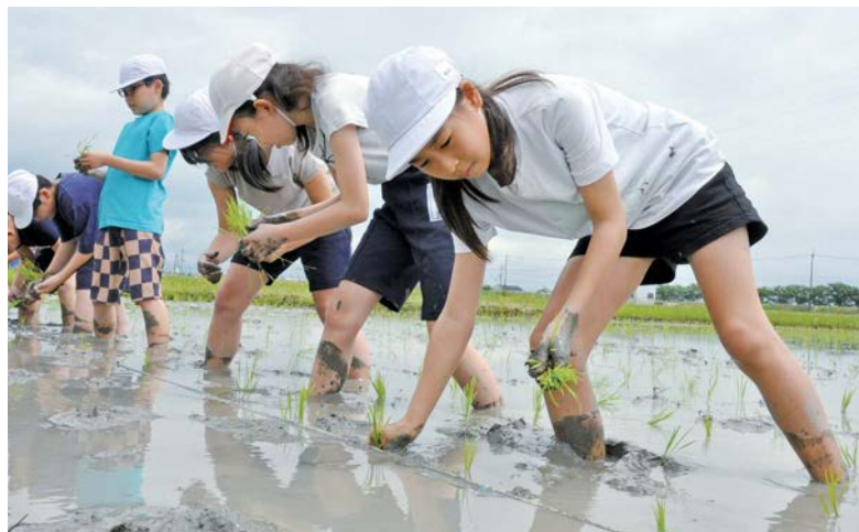
泥だらけになりながら苗を植える児童

昔ながらの田植え体験 中央小5年生45人 社会科授業で 6月9日、中央小学校5年生45人が、八幡舞台の田んぼで、昔ながらの手作業での田植えを体験しました。同体験は、社会科の「わたしたちの食生活と食料生産」の一環。米作りの苦労やお米のありがたみを児童に学んでもらおうと、地元農家の協力を得て毎年実施しています。苗の束を持って、裸足で田んぼに入った児童は「ぬるぬるする」と、悲鳴を上げながら持ち場へ移動。田んぼに張