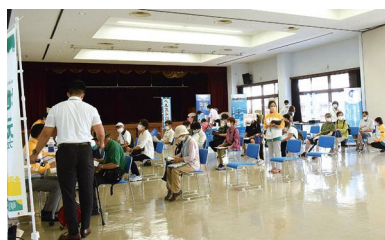
昨年の健幸マルシェの様子

■参加条件 次のすべてを満たす人。 ▼令和5年7月末時点で20歳以上で、市内在住または在勤 ※年度途中で市外へ転出・転勤等をされた場合は、その時点で退会。 ▼本事業のアンケートに協力できる ▼参加者の管理、および事業効果分析を目的とした個人情報提供に同意できる ▼体組成測定会(左の表)に参加できる ■申請方法 ①郵送または持参 指定の申請書に必要事項を記入し、郵送(〒614-8501 市役所健康推進課健康増進係)