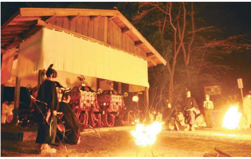
▶ 二ノ鳥居前に建てられた絹屋殿に到着した3基の御鳳輦

石清水八幡宮で9月15日、「生きとし生けるもの」の平安と幸福を願う勸祭「石清水祭」が斎行されました。新型コロナウイルス感染症の影響で、本来の形式での斎行は4年ぶり。