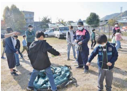
昨年のこども防災デイキャンプの様子

防災意識と知識の向上を目的に子ども体験型防災訓練を、男山やってみよう会議(防災グループ)と共催で実施します。防災デイキャンプに参加し、きみもこども防災リーダーになろう!