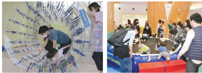
サイバーホイール