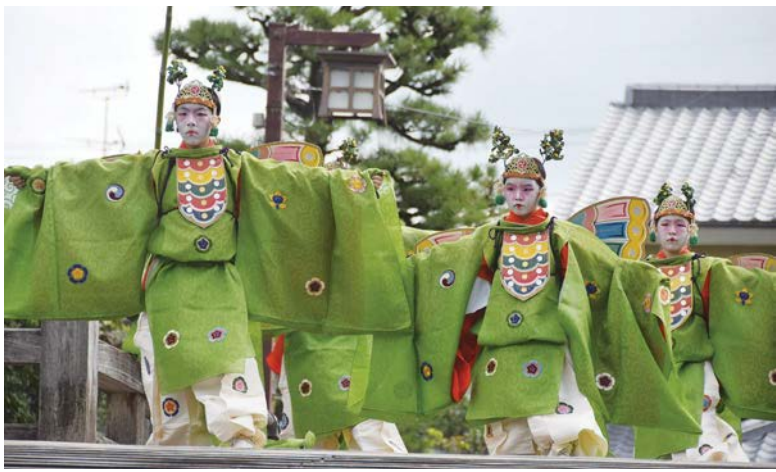
▲ 安居橋上で奉納された胡蝶の舞