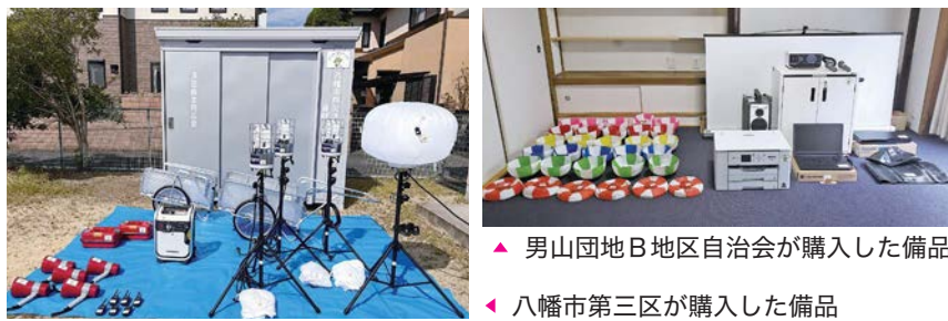
▲ 男山団地B地区自治会が購入した備品 ▼ 八幡市第三区が購入した備品

一般財団法人自治総合センターが宝くじ社会貢献広報事業として実施しているコミュニティ助成事業(宝くじ助成金)を活用し、以下の自治組織団体が次の備品を整備されました。