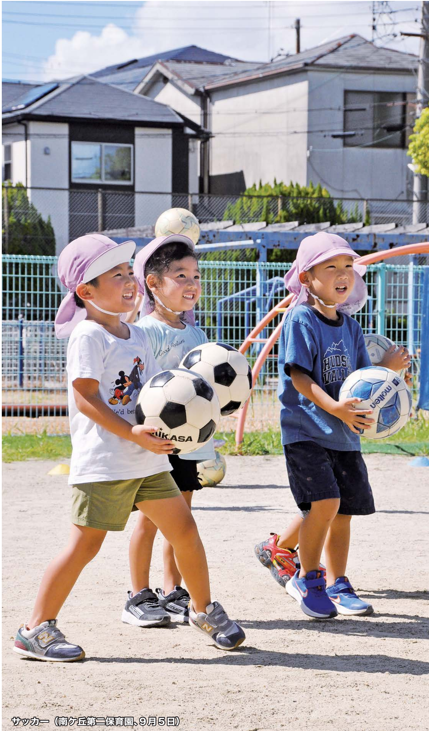
サッカー (南ヶ丘第二保育園、9月5日)