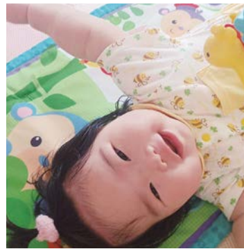
元気に遊んで大きくなってね。