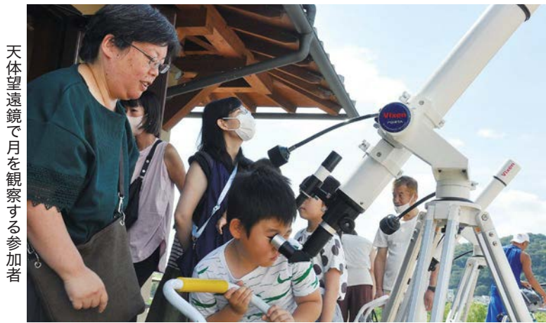
天体望遠鏡で月を観察する参加者

参加者は同館前の広場で、肉眼により雲の切れ間に現れた月の位置や形を確認。続いて、天体望遠鏡で観察すると、画面いっぱい鮮明に映し出された月に「クレーターが見える!」と驚きの声を上げていました。