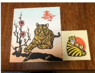
季節の切り絵教室

夜間パソコン・大人のバレエ・ストレッチ・夜間パワーヨガ・椅子ヨガ・ソフトヨガ・癒しのヨガ・リフレッシュ体操・初級紅茶・初級落語・和の手芸(折り紙・つまみ細工)・季節の切り絵・大人のぬり絵・子育て広場「のびのび」等