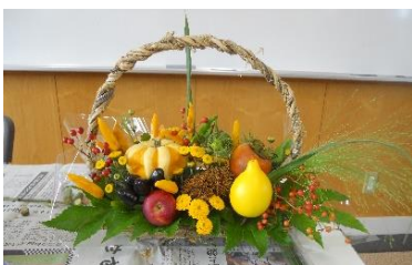
フラワーアレンジメント教室

健康体操・切り絵・脳活サロンゆうゆう・キーボード・フラワーアレンジメント・布ぞうり・手話・英会話