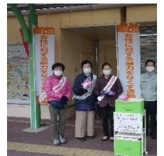
●【街頭啓発】11/12(金) 八幡市女性団体連絡協議会の皆さん (京阪石清水八幡宮駅前)

日本では「内輪(内集団)」での暴力を外に訴えることは、タブー視されてきたため、パートナーからの暴力を警察へ通報する件数が少ない実態について改めて知ることができました。