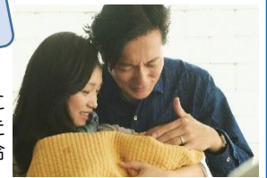
C) 2020「朝が来る」Film Partners

※今後の新型コロナウイルスの感染状況により、パン・ちらし寿司の販売を中止したり、るーぶフェスティバルを中止する場合があります。ご了承ください。