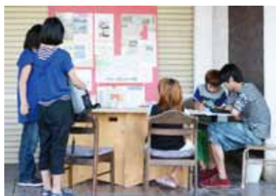
だんだんテラスに集まる子どもたち。学年問わず集まって遊ぶ姿をよくみかける。

先日、緑道を歩いていると、中学生、高校生たちと高齢者の方、市役所の職員、警察官が集まって団地内の清掃活動をされている姿をみかけました。清掃活動を通して、色んな世代が交流をもてる機会が男山にあるんだなあと感じました。「清掃」1つとっても、こうして人が集まることができることもあるし、個人の心がけで出来ることもあります。例えば階段の入り口あたりの不要な物を整理し、掃除してみるだけでも気持ちよさが違ってくるように思います。