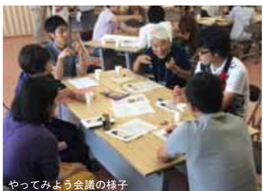
やってみよう会議の様子