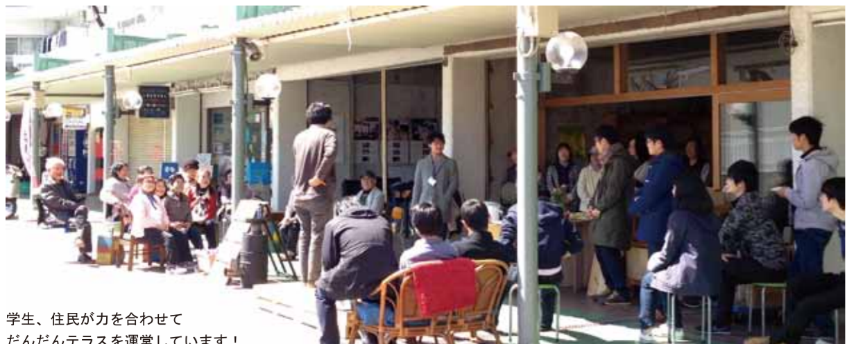
学生、住民が力を合わせてだんだんテラスを運営しています！

65歳以上の人口が過去最高となり、大阪、京都のベッタウンと言われた男山地域にお住まいの方も、通勤よりも自宅周りを移動する機会が増えることが予想されます。地域の身近な外部環境、特に南北2kmに渡る緑道の価値を見直すことは、「これからの暮らし」を考える上で、一つの機会となるのではないのでしょうか？今月は「緑道」にまつわる情報をお届けします！