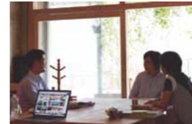
京都府建築士会からこれら専門家が無料で相談に応じています。

《《 活動の経緯は? 団地や戸建てに関わらず、住まいに関するお困りごとを気軽に相談出来る場所です。