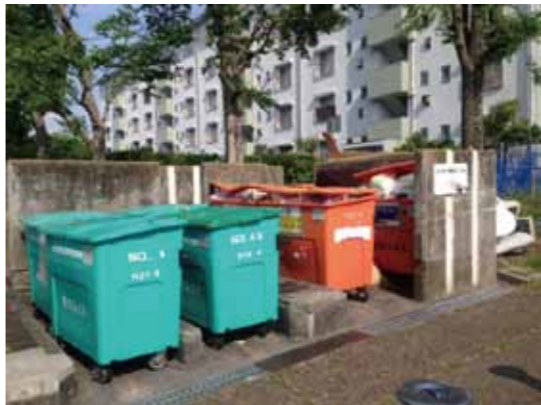
ボックスの外にゴミを放置するとカラスが荒らしてしまうケースがある。そうなるとその後の清掃が一苦労。