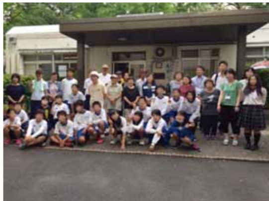
協働による清掃活動も今年で3年目となりました。